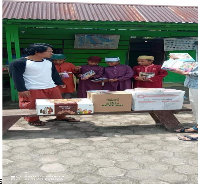
Penerimaan Sumbangan Buku