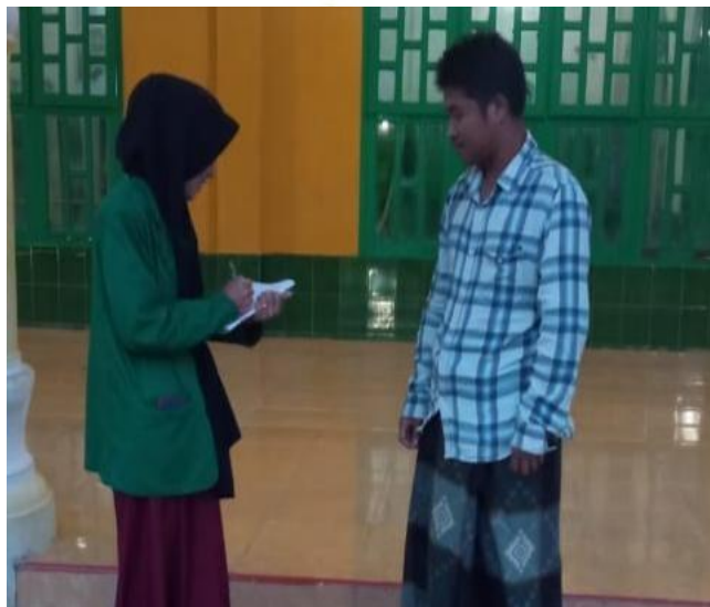
Wawancara bersama Guru PAI