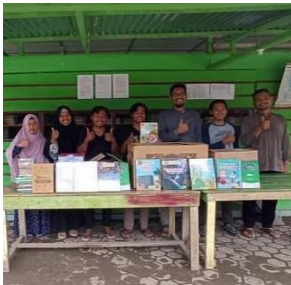
Foto Bersama Donatur Buku