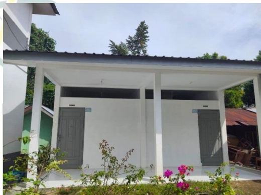
Kamar Mandi Guru