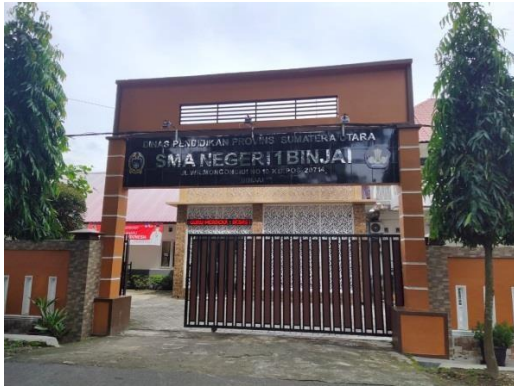
Gerbang depan Sekolah