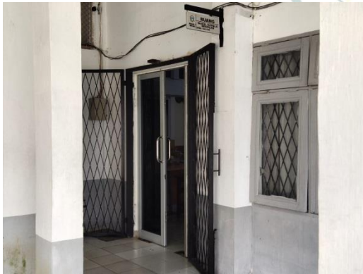
Kantor Kepala Sekolah