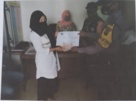
FOTO/DOKUMENTASI PEMBAGIAN BLT-DD BULAN SEPTEMBER 2020