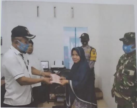
FOTO/DOKUMENTASI PEMBAGIAN BLT-DD BULAN NOVEMBER 2020