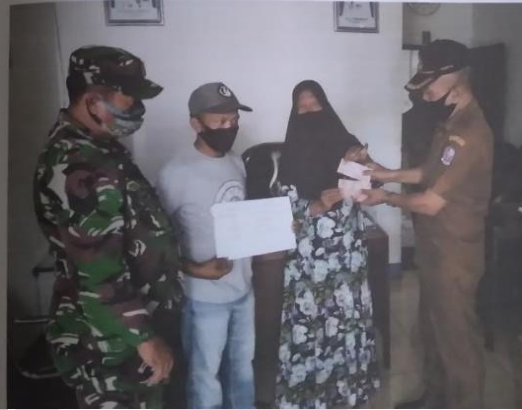
FOTO/DOKUMENTASI PEMBAGIAN BLT-DD BULAN OKTOBER 2020