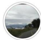
Arah Jalan keBIS 📍