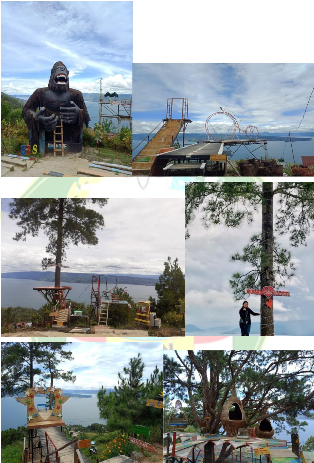
(Wisata non bergerak Bukit Indah Simarjarunjung dan Icon BIS adalah berbentuk lambang love)