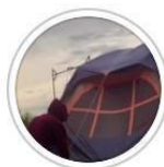
CAMPING BIS 🏕️