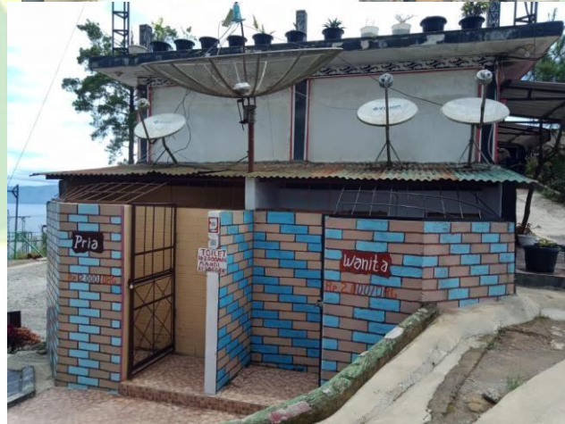
(Fasilitas yang ada di wisata Bukit Indah Simarjarunjung)