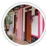
GUEST HOUSE ...