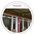
Price list 🗄️