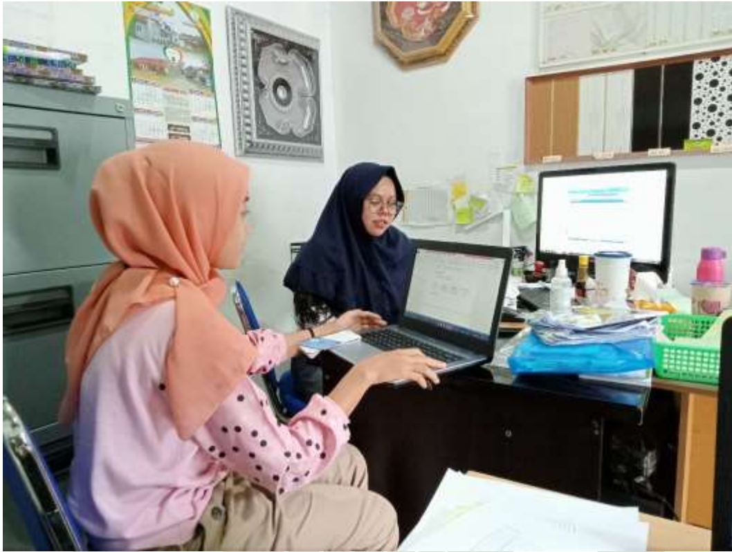
Foto saat melakukan penelitian pada PT. Bagus Plafon PVC Medan

UNIVERSITAS ISLAM NEGERI SUMATERA UTARA MEDAN