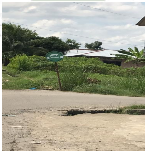
Papan penunjuk Arah