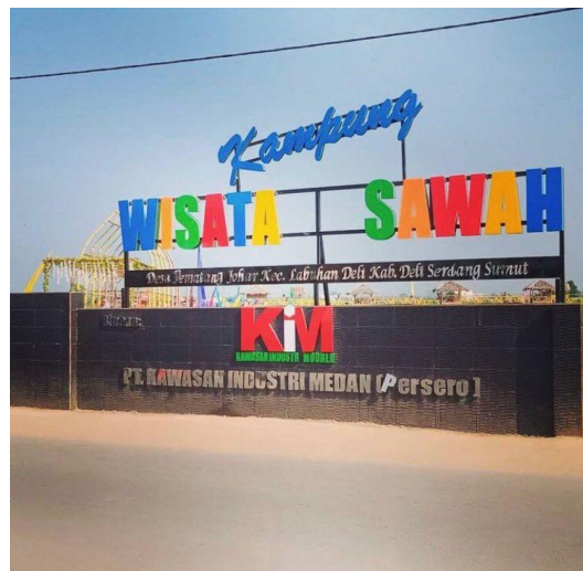
Pintu Awal masuk wisata desa pematang johar