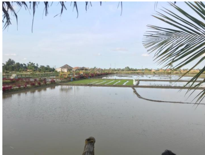
Saat objek padi sudah di panen