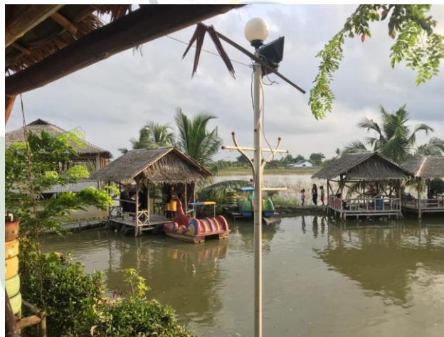
Wahana Air bebek