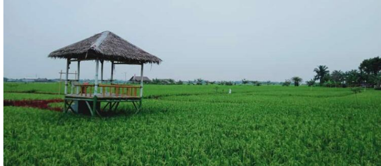
Suasana saat objek padi dapat dilihat