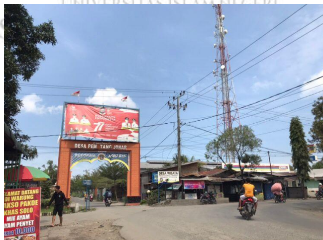
Pintu Masuk ke lokasi wisata desa pematang johar