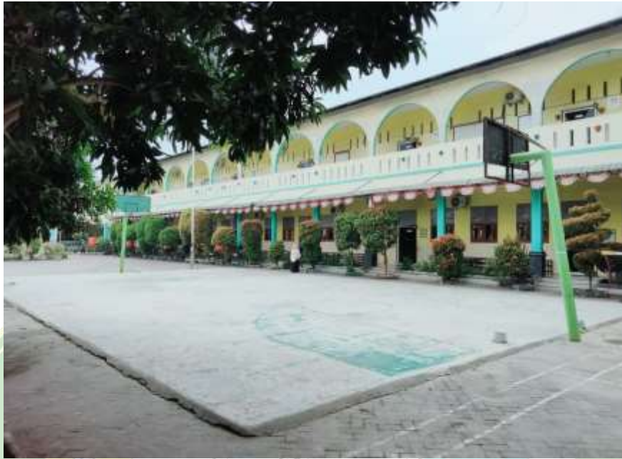
Kantor Sekolah SMP IT Al-Hijrah