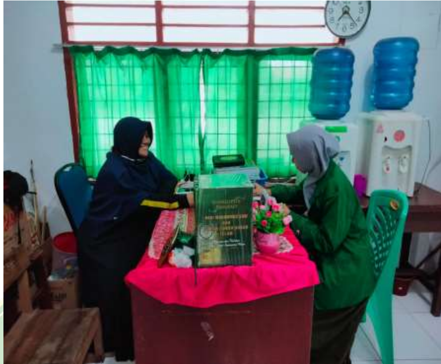
Wawancara dengan Wakasek Kesiswaan SMP IT Al-Hijrah