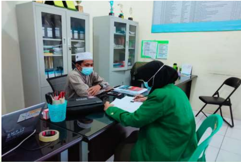
Wawancara dengan Bendahara / Guru bidang studi Bahasa Arab