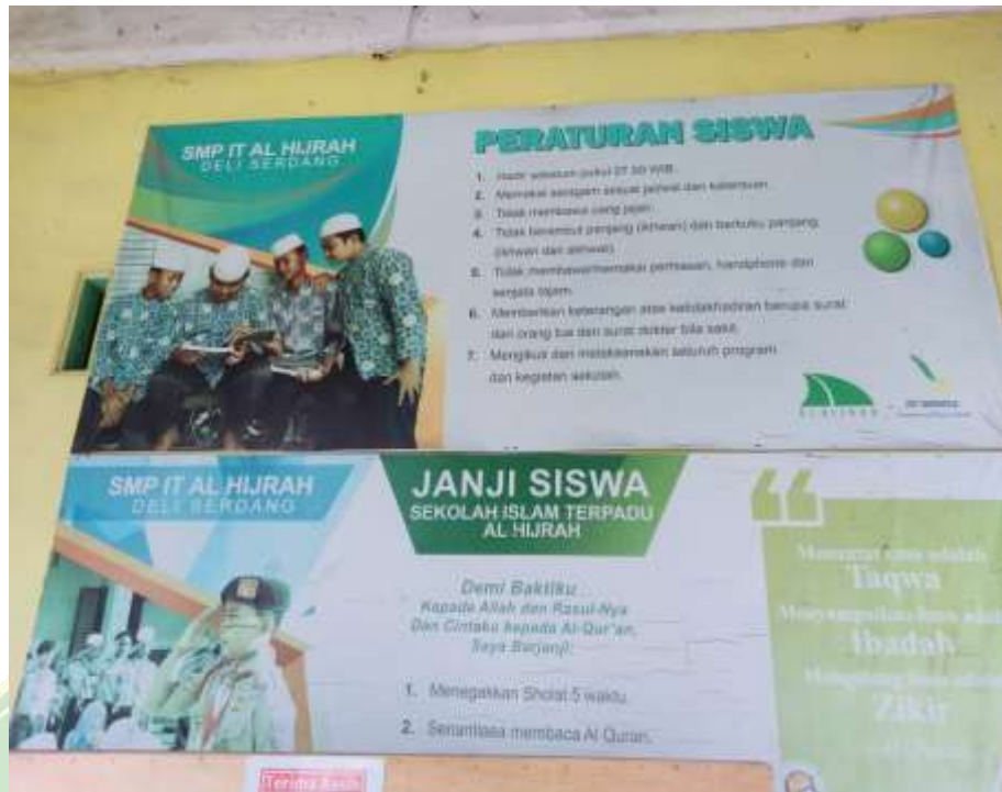
Ruang Komputer Sekolah SMP IT Al-Hijrah