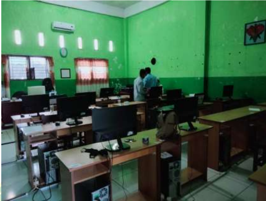
Ruangan Kelas SMP IT Al-Hijrah