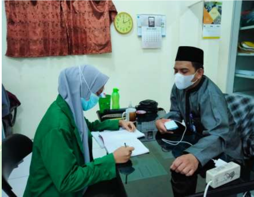
Wawancara dengan guru bidang Studi B.Indonesia