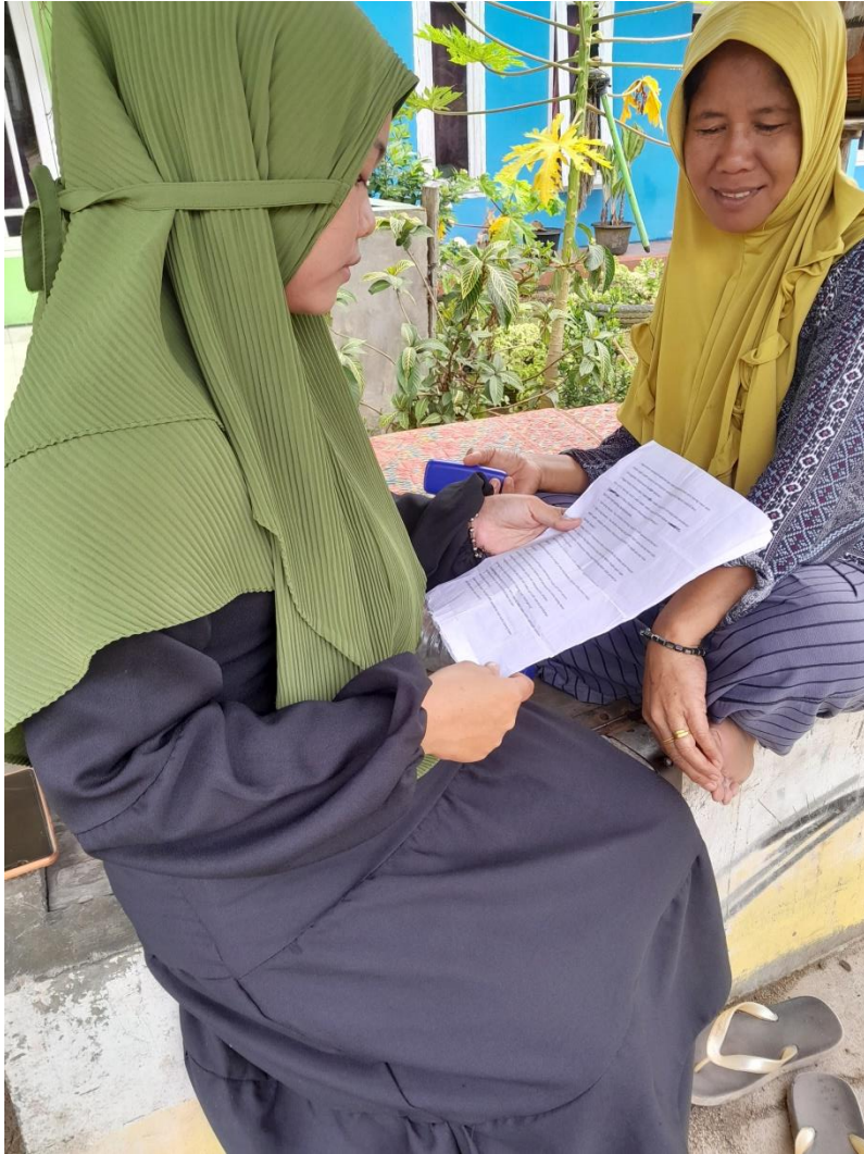
SUMATERA UTARA MEDAN