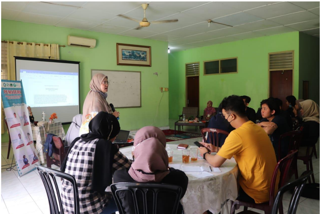
Pelatihan Jurnalistik Tingkat Lanjut Nasional, Pena Persma 2021