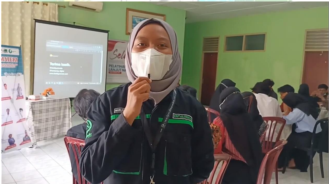
Live Report LPM Dinamika di Instagram