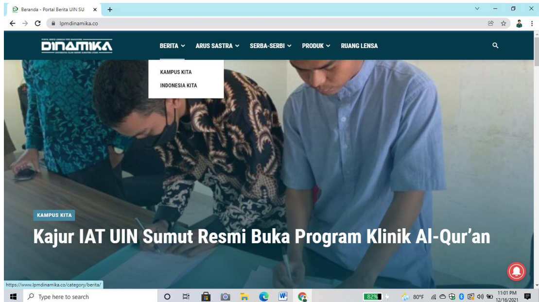
Halaman Beranda Portal Berita LPM Dinamika www.lpmdinamika.co