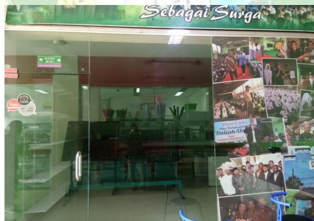
Gambar: Bank Mini Sekolah SMK tritech informatika medan.