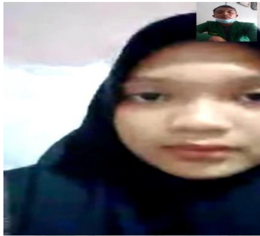
Gambar: Wawancara dengan siswa SMK Tritech Informatika Medan