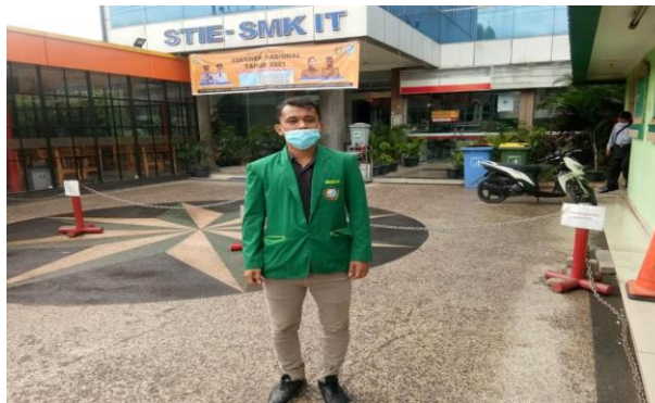
Gambar: SMK Triteck Informatika Medan jl. Bayangkara no.484 Indra Kasih, kec. Medan Tembung, Kota Medan