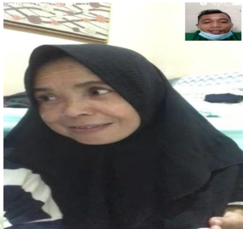
Gambar: Wawancara dengan orang tua siswa SMK Trittech Informatika Medan