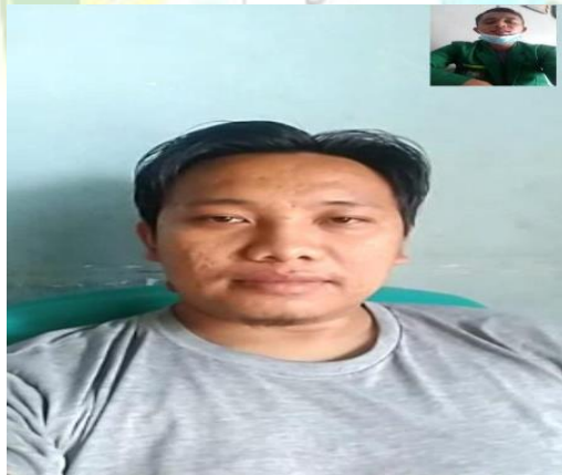
Gambar: Wawancara dengan orang tua siswa SMK Tritech Informatika Medan