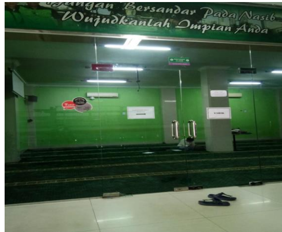
Gambar: Mushollah SMK Tritech Informatika Medan