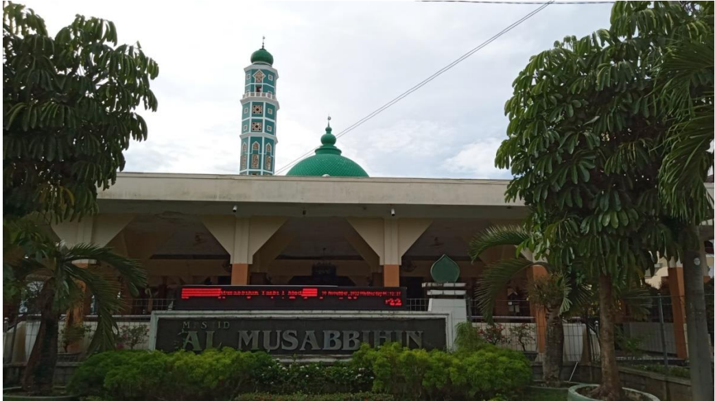
Depan Masjid Al-Musabbihin