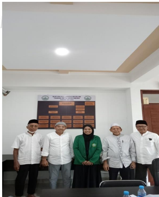
Bersama Bapak BKM Masjid Al-Musabbihin