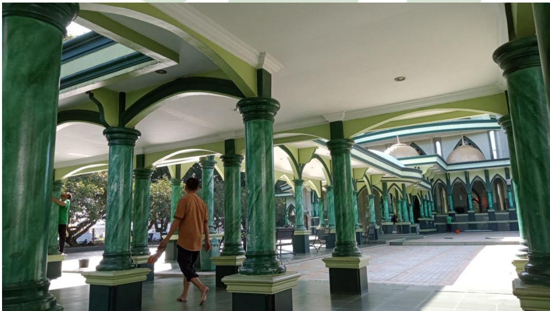
Di Luar Masjid Al-Musannif