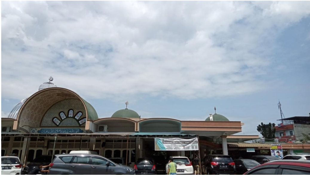
Masjid Al-Jihad dari depan