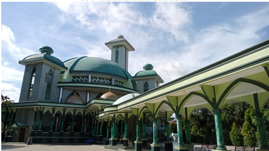
Depan masjid Al-Musannif