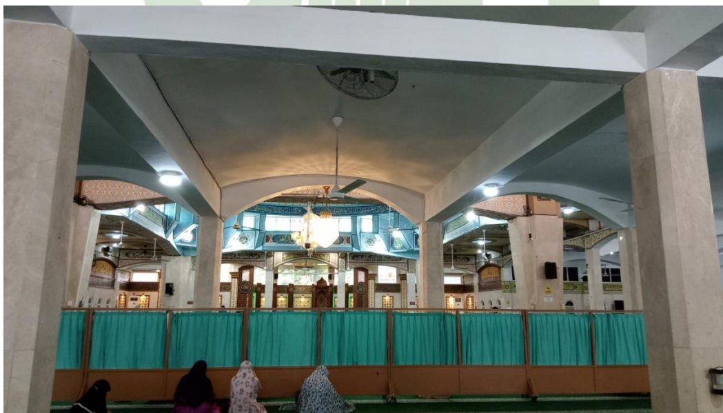
Dalam Masjid Al jihad