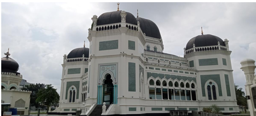
Depan Masjid Raya Al-Mashun