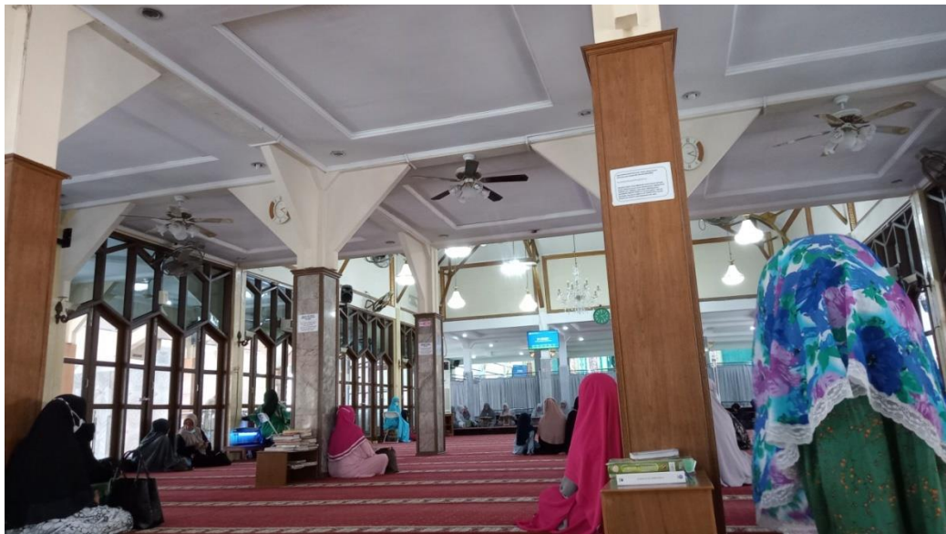
Ibu- ibu lagi pengajian