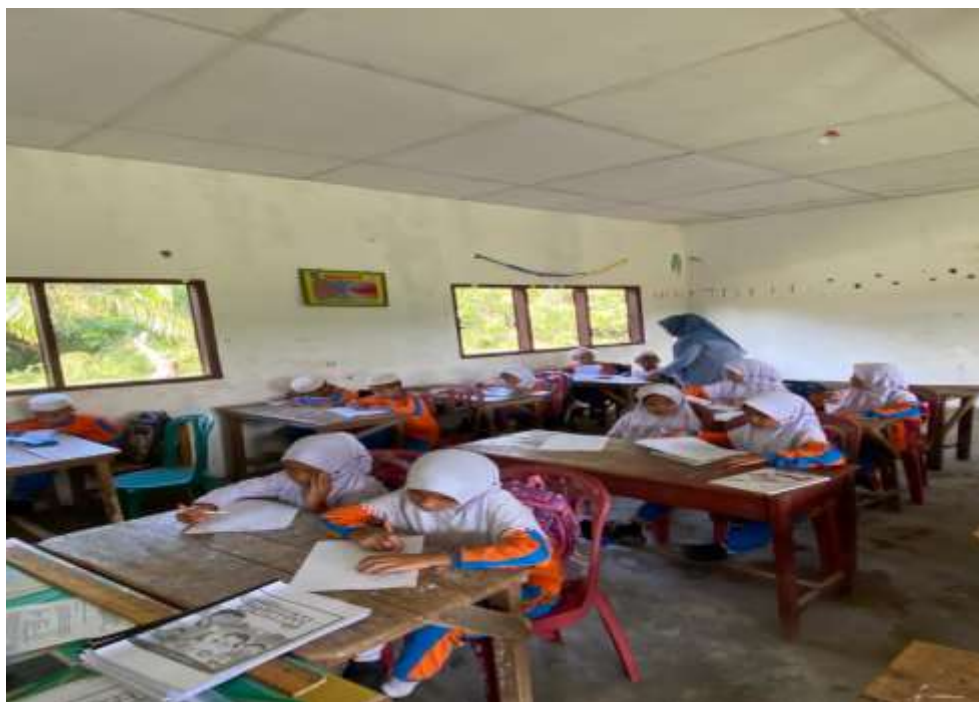
Foto saat mengerjakan soal