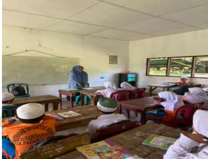
Foto sebelum melaksanakan pre test