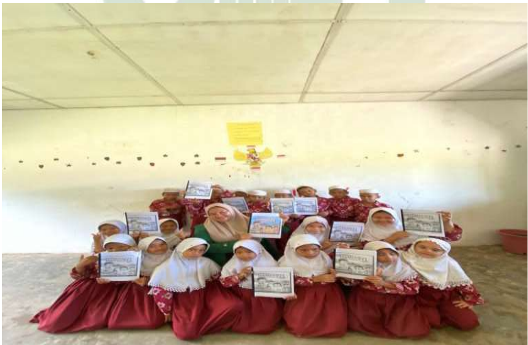
Foto bersama murid kelas IV