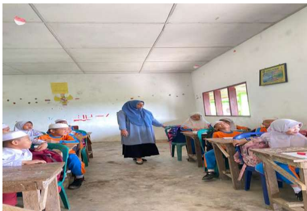
Foto saat menjelaskan materi