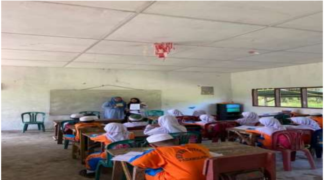
Foto bersama wali kelas