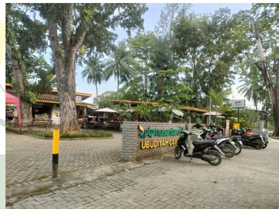
Foodcourt Ubudiyah Centre PTPN II