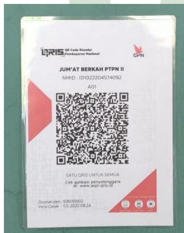
Barcode Jumat Berkah PTPN II