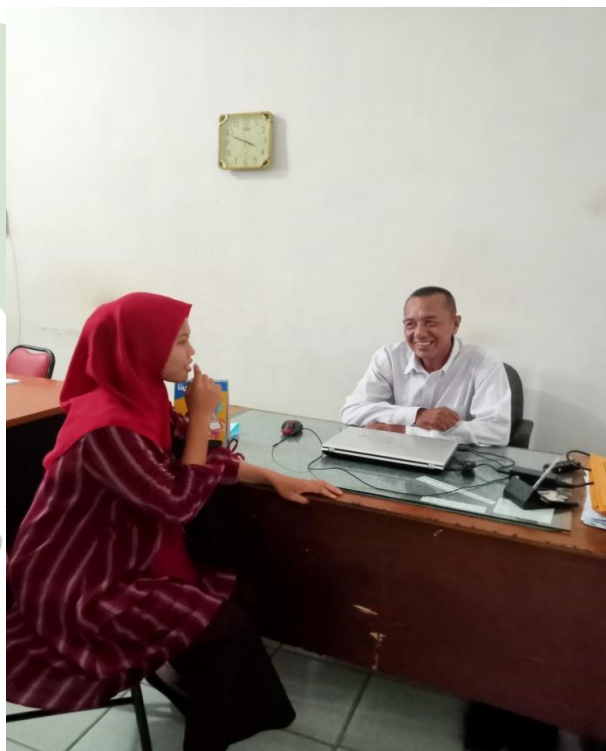
Lampiran 10. Pedoman Wawancara Lampiran 12. Pedoman Wawancara