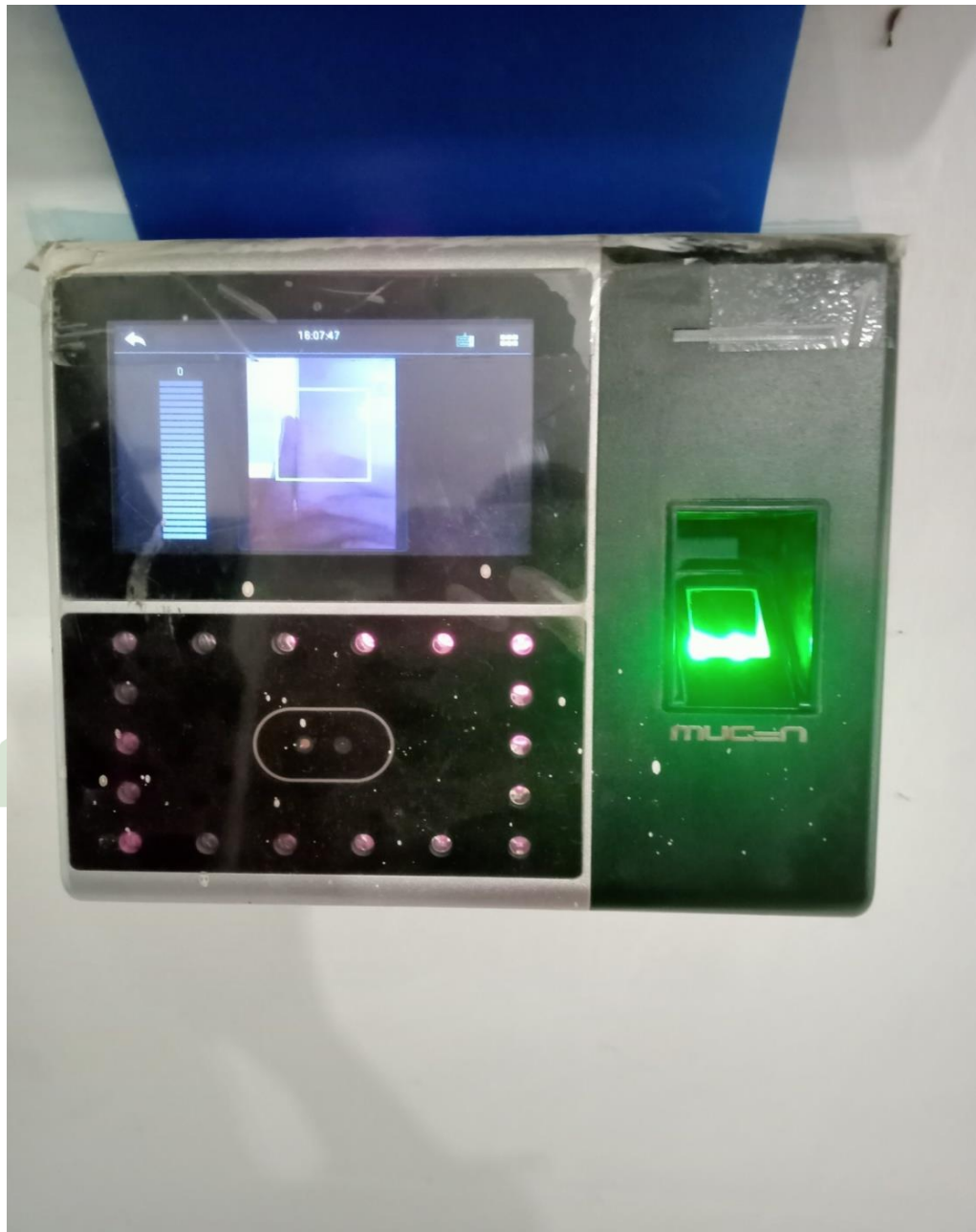
Lampiran 7. Pringerfrint