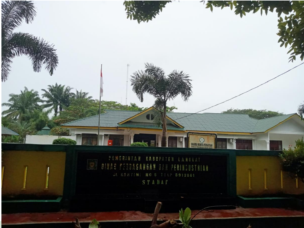
Lampiran 9. Lokasi Penelitian

UNIVERSITAS ISLAM NEGERI SUMATERA UTARA MEDAN