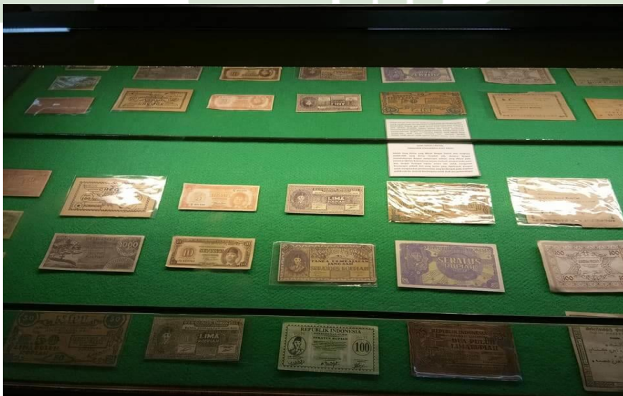
Ket. Beberapa koleksi Uang Kertas di Museum Uang Sumatera