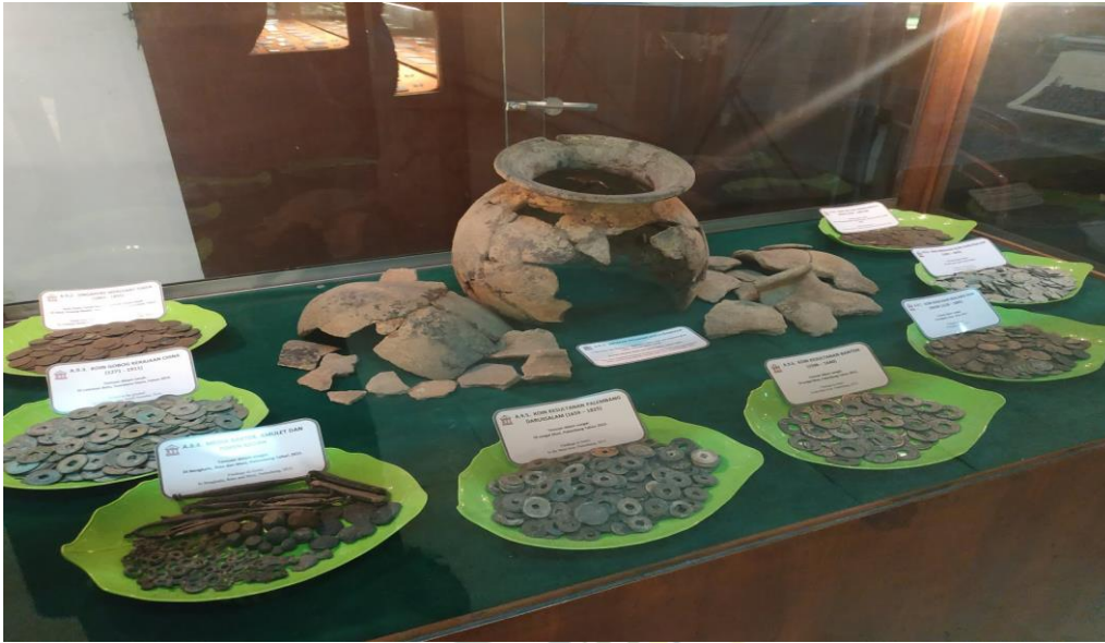
Ket. Temuan uang logam dalam satu wadah di Museum Uang Sumatera