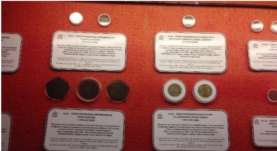
Ket. Beberapa koleksi Uang Koin di Museum Uang Sumatera