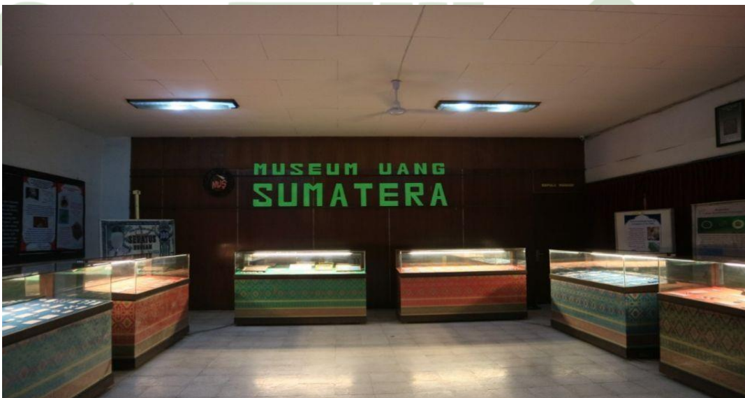
Ket. Ruangan tempat penyimpanan uang koin kuno di Museum Uang Sumatera