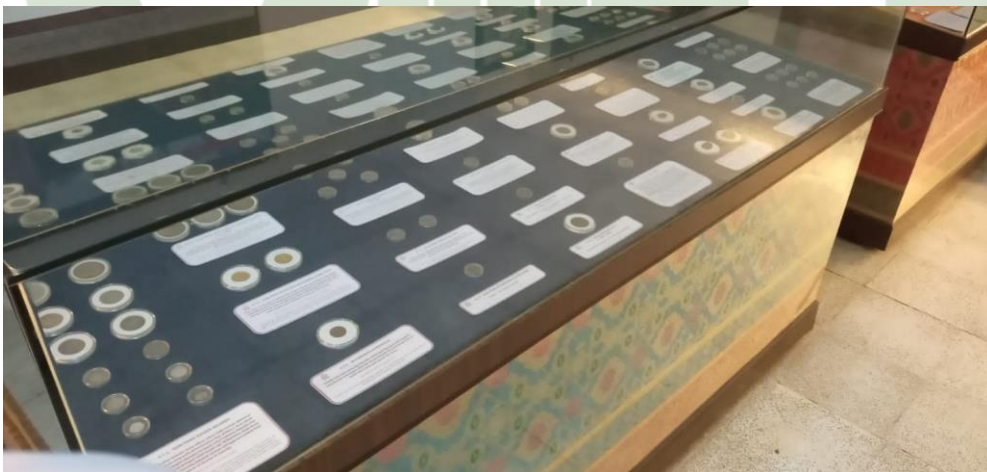
Ket. Koleksi Uang Kuno Di Museum Uang Sumatera