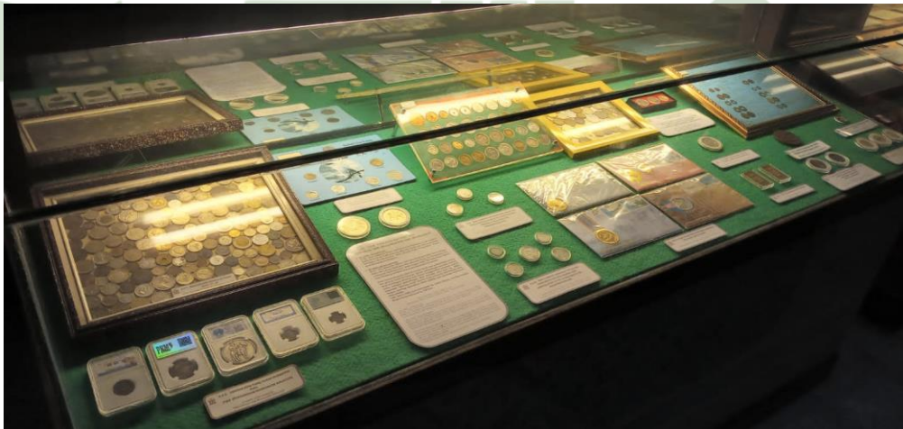
Ket. Beberapa koleksi Uang Koin di Museum Uang Sumatera

SUMATERA UTARA MEDAN