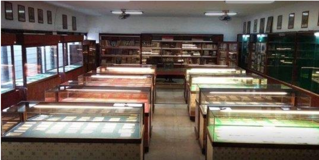
Ket. Ruangan tempat penyimpanan uang kertas kuno di Museum Uang Sumatera