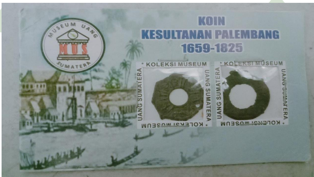
Ket. Bentuk tiket masuk ke Museum Uang Sumatera