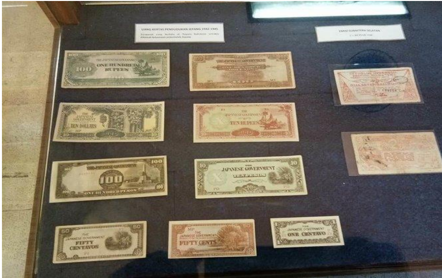
Ket. Koleksi Uang Kertas di Museum Uang Sumatera