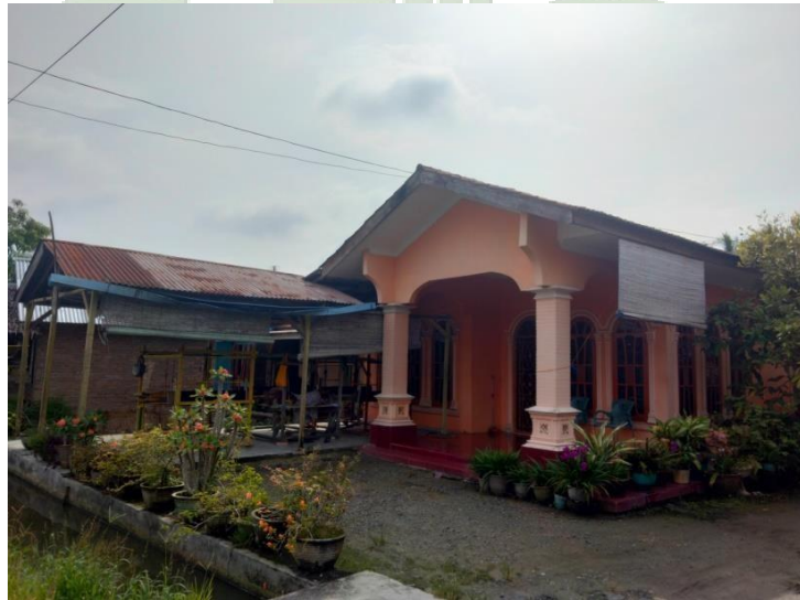
(Lokasi tempat usaha Azhar Abdullah Tenun Songket)