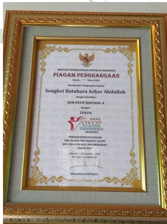
(Sertifikat Penghargaan yang didapati Azhar Abdullah Tenun Songket telah mendapat penghargaan IKM OVOP Bintang 4)