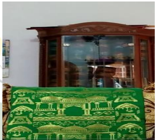
(Gambar Produk yang dihasilkan oleh Azhar Abdullah Tenun Songket)

UNIVERSITAS ISLAM NEGERI SUMATERA UTARA MEDAN