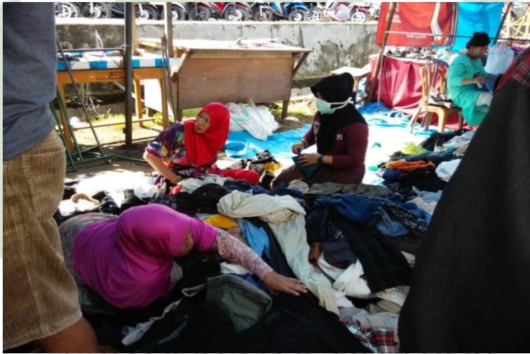
Proses pembeli dalam menawarkan harga terhadap penjual