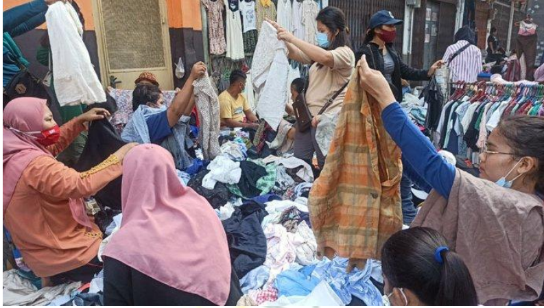
Proses penjual dalam memaparkan beberapa pakaian bekas