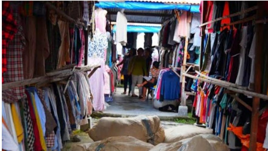
Suasana toko penjual pakaian bekas disertai dengan masa PPKM dan pandemi