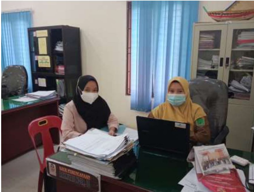
Gambar 4. Wawancara dengan kaur Pembangunan