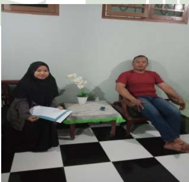
Gambar 5. Wawancara dengan Kepala Dusun