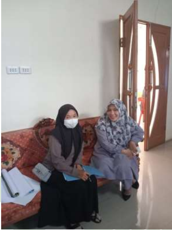
Gambar 3. wawancara dengan Kaur Umum

UNIVERSITAS ISLAM NEGERI SUMATERA UTARA MEDAN