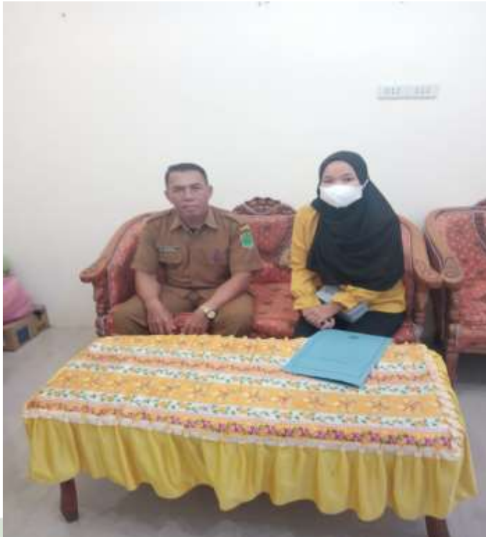
Gambar 5. wawancara dengan Sekretaris Desa

UNIVERSITAS ISLAM NEGERI SUMATERA UTARA MEDAN