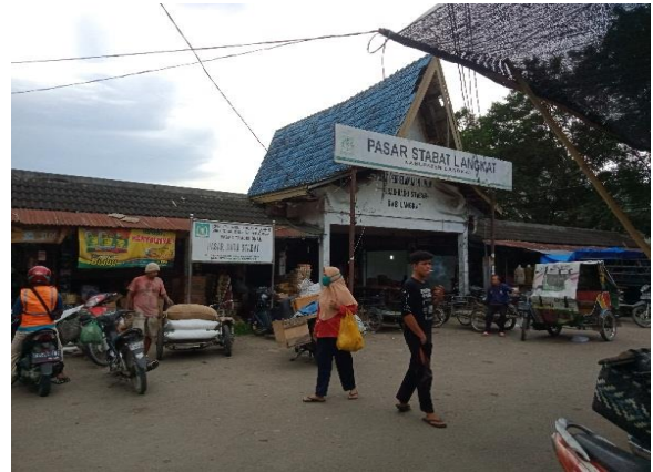
Gambar 5 dan 6 : Lokasi Pasar Baru Stabat