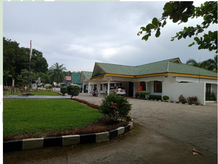
Gambar 3 dan 4 : Kantor Dinas Perindustrian dan Perdagangan Kabupaten Langkat