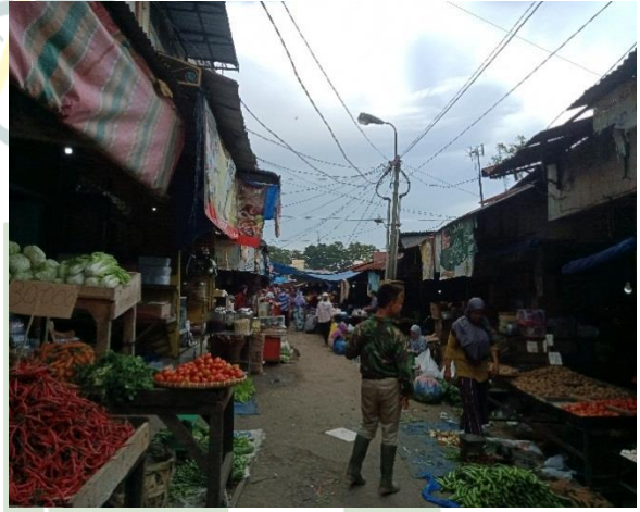
Gambar 7 dan 8 : Lokasi penjualan para pedagang Pasar Baru Stabat