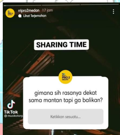
Story Instgram RRI Pro 2 untuk menarik komentar pendengar