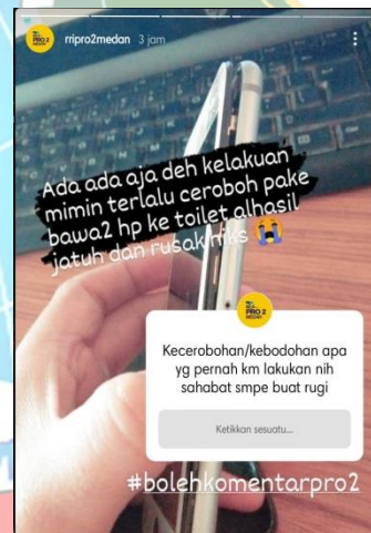
Story Instgram RRI Pro 2 Medan untuk menarik pengikutnya berinteraksi