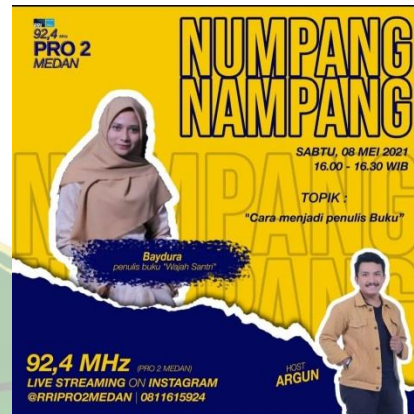
Flyer Siaran Numpang-Numpang di Isntagram RRI Pro 2 Medan