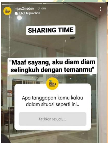
Story Instgram RRI Pro 2 Medan untuk menarik pengikutnya berinteraksi