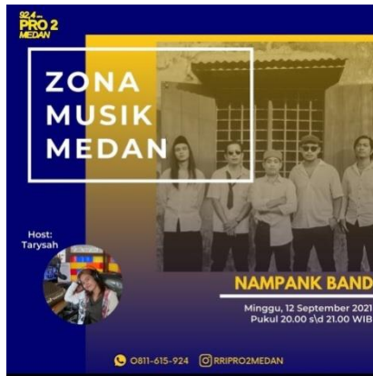
Flyer Siaran Zona Musik di Isntagram RRI Pro 2 Medan