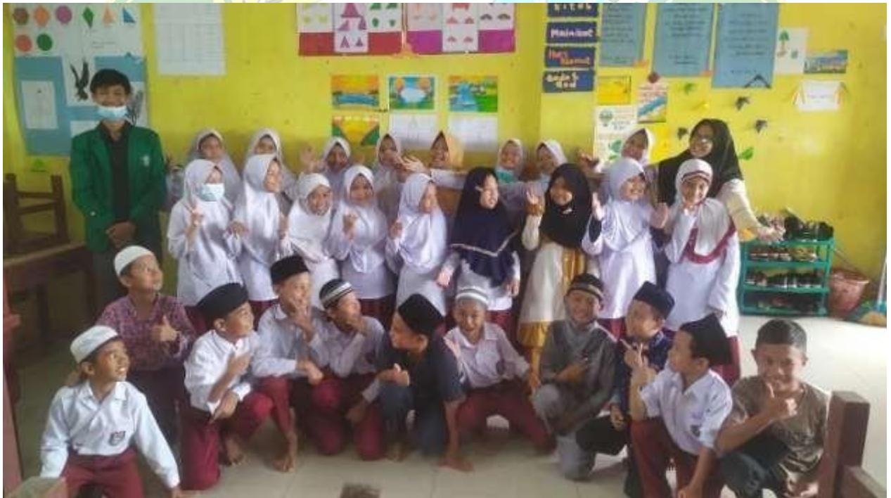
Foto Bersama Siswa Kelas V