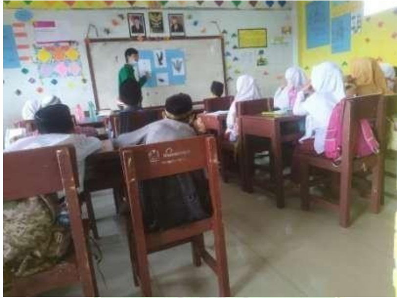
Menyampaikan Materi Dengan Menggunakan Media