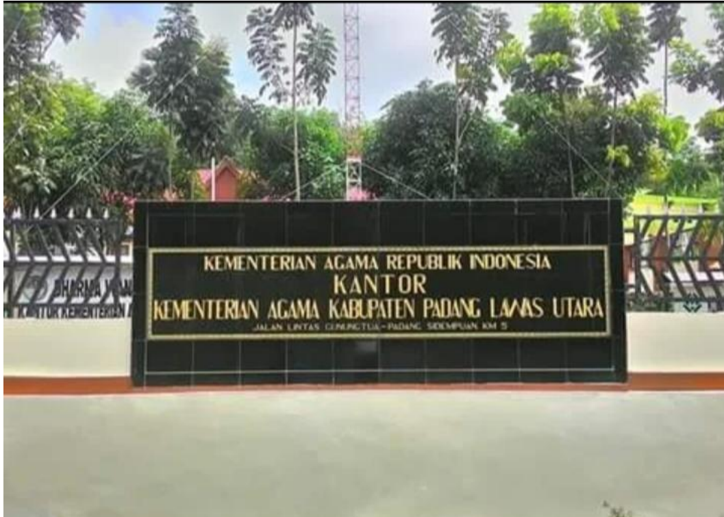
Gambar 2. Kantor Kementrian Agama Padang Lawas Utara