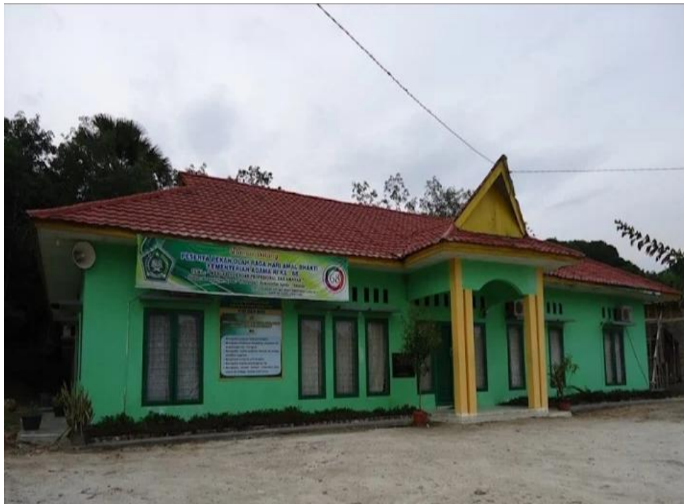
Gambar 4 Visi dan Misi Kantor Kementerian Agama