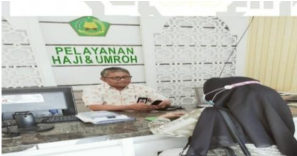
Wawancara Kedua : Bersama Bapak Drs. H. Permohonan Sebagai Kepala Seksi Pelayanan Haji Dan Umra