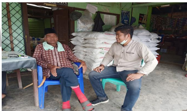
Wawancara : Tokoh Adat