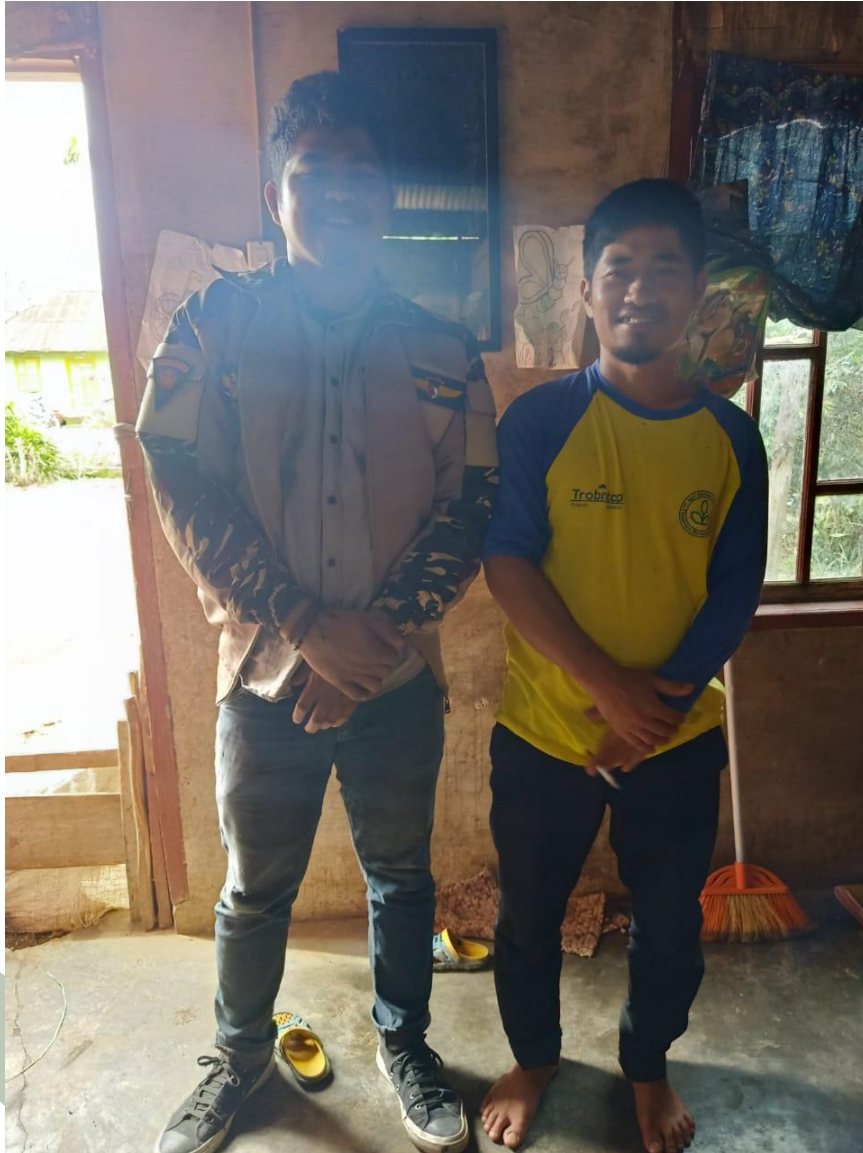
Wawancara : Tokoh Pemuda/Ketua Karang Taruna