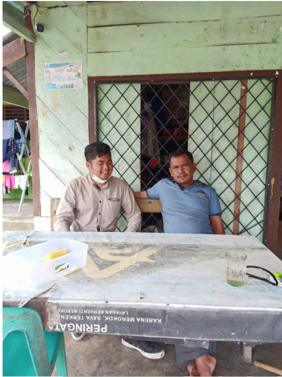
Wawancara : Masyarakat