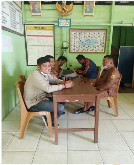
Diskusi bersama Aparat Desa