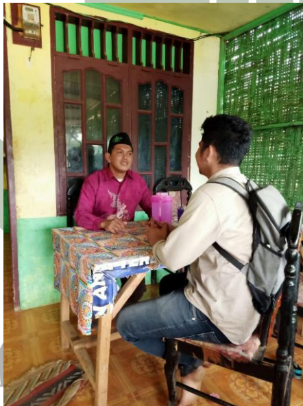
Wawancara : Tokoh Agama