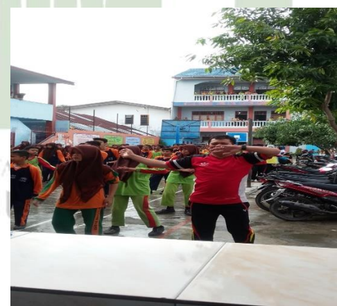
Gambar : Program unggulan dan ekstrakurikuler sekolah