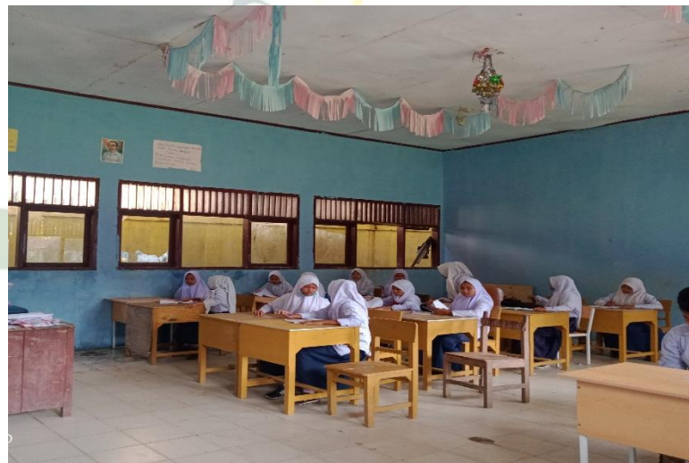
Gambar : Mengamati kegiatan belajar mengajar