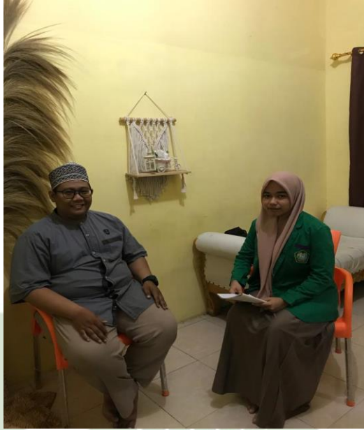
Wawancara bersama Ketua BKM Masjid As-Salam