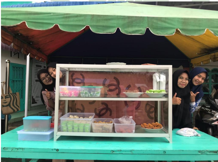
Kegiatan berjualan takjil di Bulan Suci Ramadhan