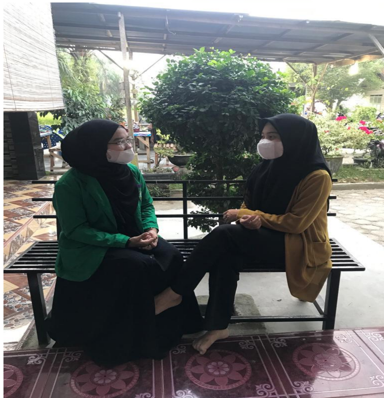
Wawancara bersama salah satu anggota Remaja Masjid As-Salam