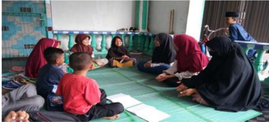
Kegiatan mengaji di sore hari di Masjid As-Salam Desa Sei Kamah II