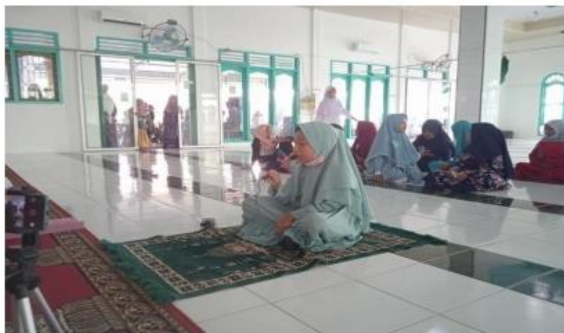
Kegiatan lomba membaca alquran di Masjid As-Salam Desa Sei Kamah II