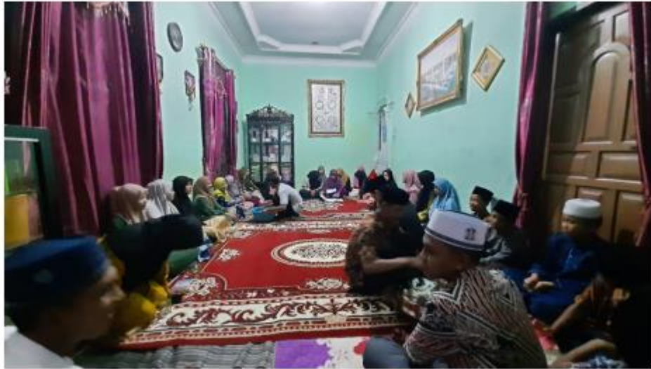
Kegiatan rutin membaca Yasin setiap seminggu sekali