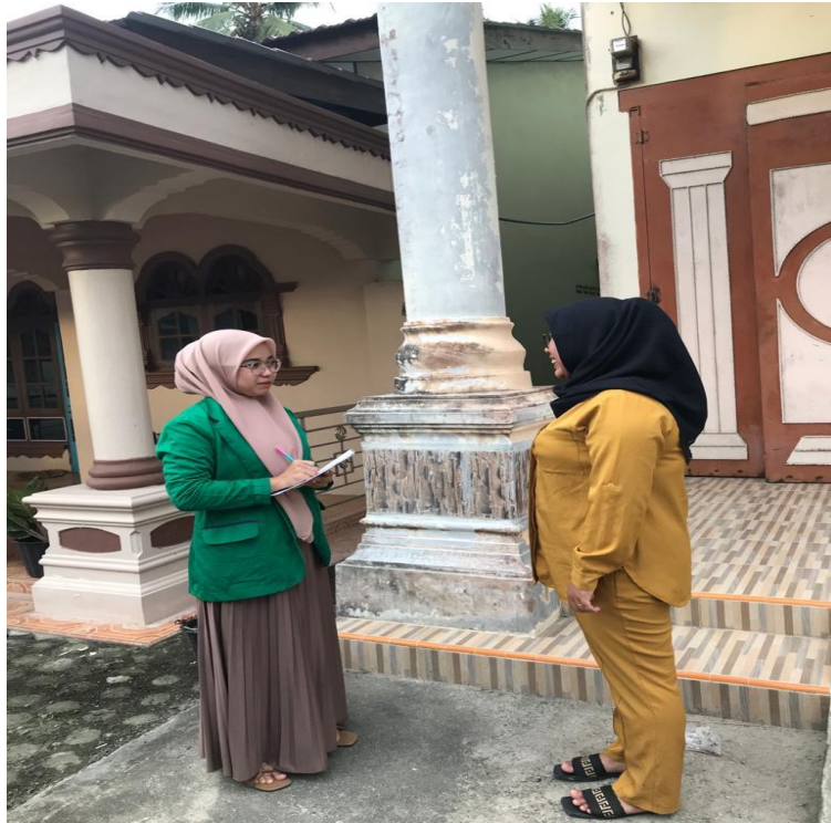
Wawancara bersama masyarakat Desa Sei Kamah II