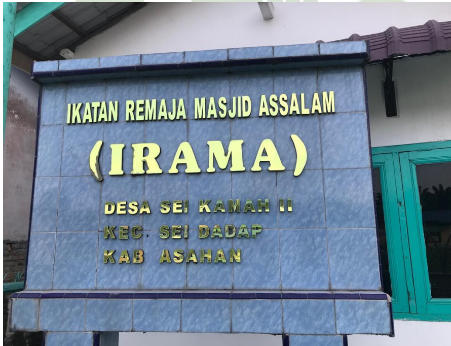
Plang Remaja Masjid As-Salam Desa Sei Kamah II