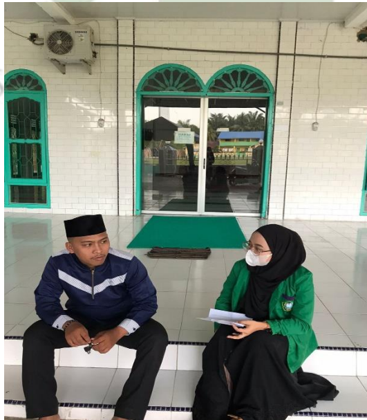
Wawancara bersama Ketua Remaja Masjid As - Salam