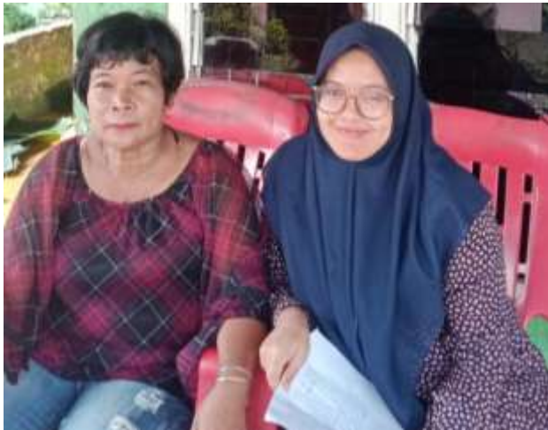
Gambar 8 Ibu Borneo Ibu Ber Masyarakat Kelurahan Suka Ramai