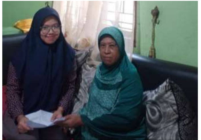
Gambar 10 Ibu Raut Ibu Ber Masyarakat Kelurahan Suka Ramai