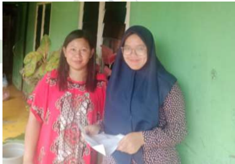
Gambar 6 Ibu Ber Masyarakat Kelurahan Suka Ramai