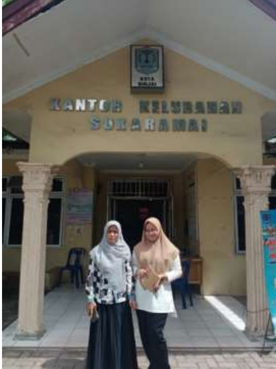
Gambar 2 Pengurus Kantor Lurah Kelurahan Suka Ramai