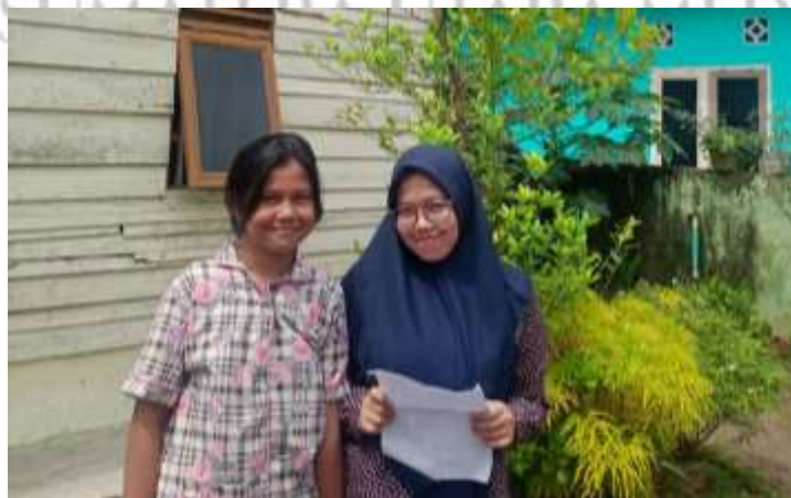
Gambar 7 Anak Ibu Ber