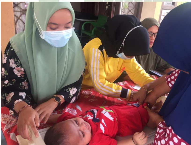
Mengukur tinggi badan balita menggunakan alat infanometer