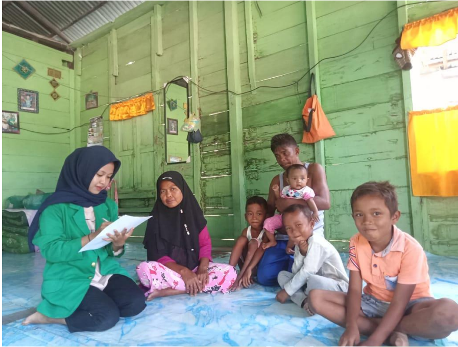
Wawancara langsung dengan responden