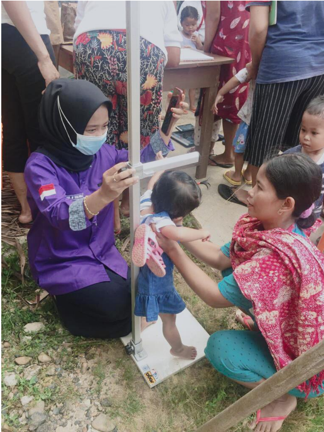
Mengukur tinggi badan balita menggunakan alat stadiometer