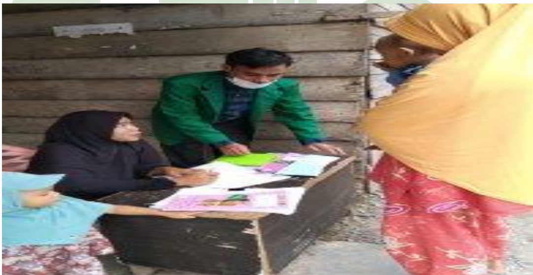
Gambar Pos Pendaftaran posyandu