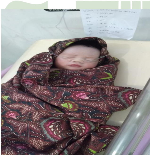
Gambaran balita desa paye munje di posyandu 6 maret 2022