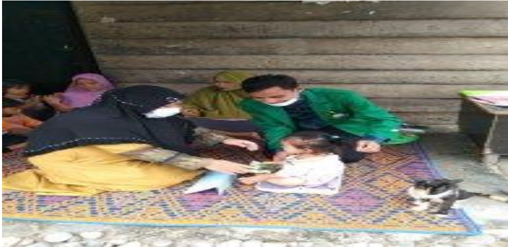
Gambar proses penimbangan anak