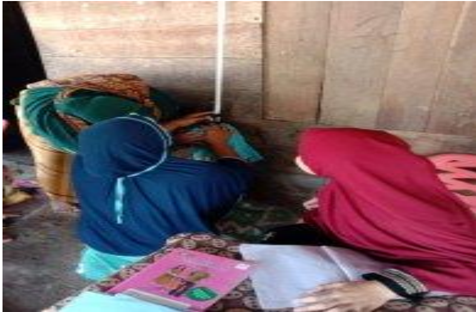
Gambar: pengukur Tinggi Badan anak