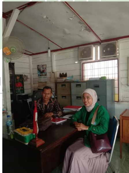
Gambar II wawancara dengan sekdes