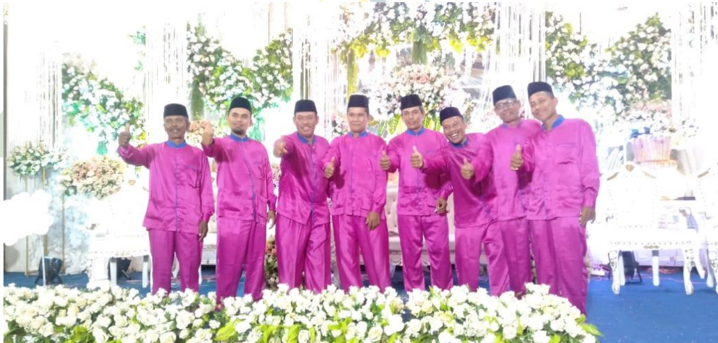
Gambar VI anggota kasidah berdah tuns muda

UNIVERSITAS ISLAM NEGERI SUMATERA UTARA MEDAN