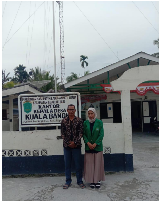
Gambar I Di depan kantor bales kuala bangka