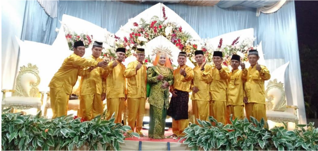
Gambar V anggota kasidah berdah dengan pengantin