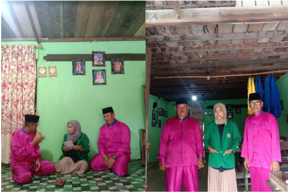
tGambar III saat melakukan wawancara