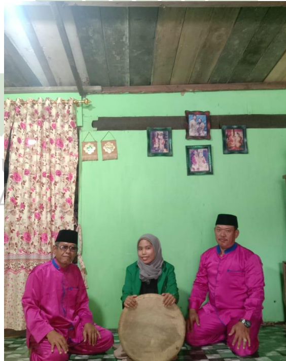
Gambar IV photo bersama dengan alat musik/gendang