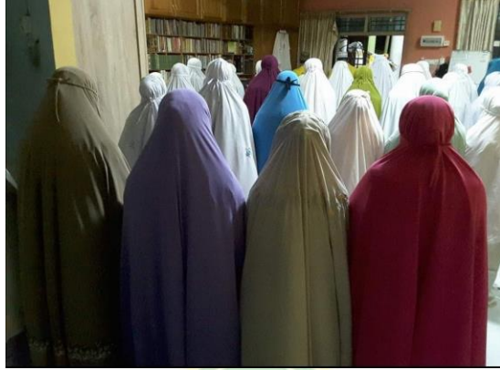
Aktivitas remaja menunaikan shalat berjemaah dan membaca Al-Quran