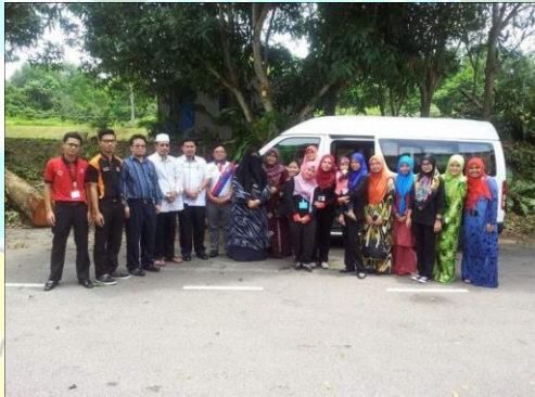
Lawatan pelajar Universitas Politeknik Metro Johor