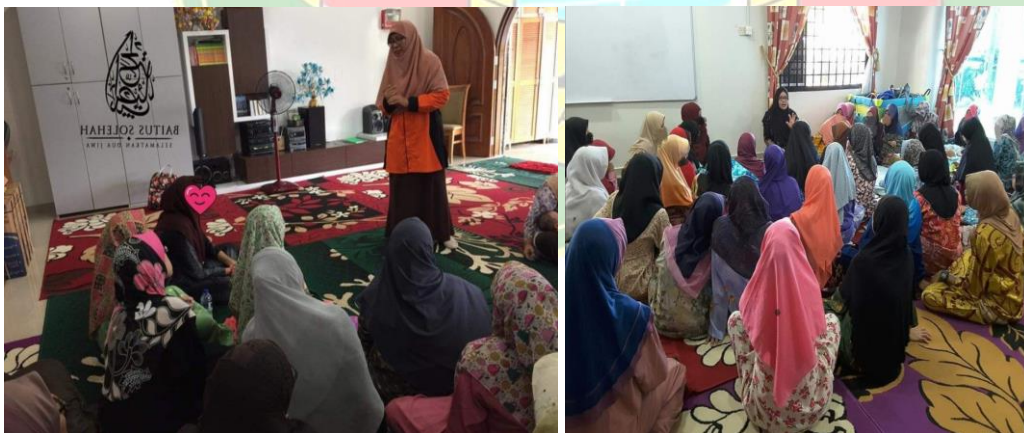
Konseling secara kelompok