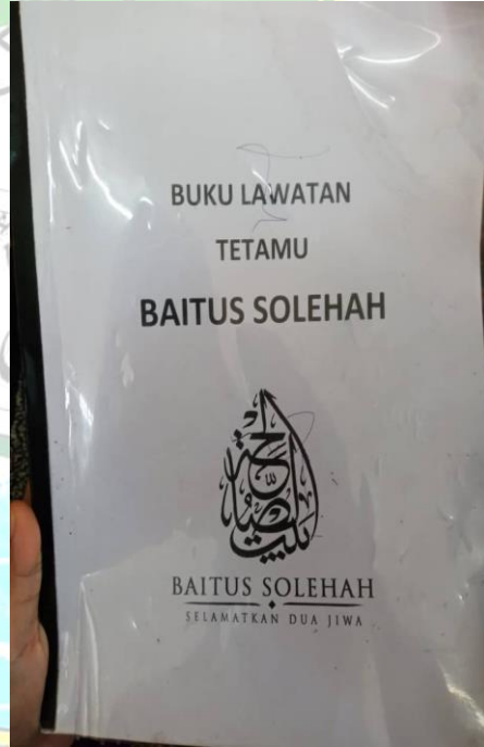
Buku Lawatan dan foto Bersama Pengurus Baitus Solehah