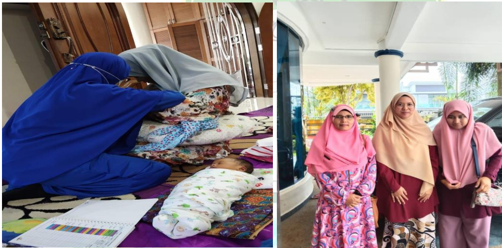
Program konseling laktasi dan foto bersama konselor laktasi