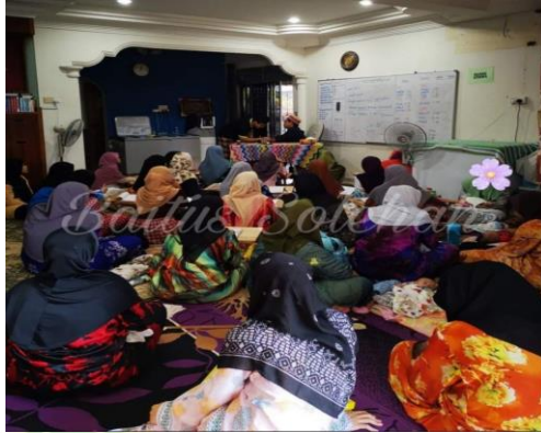
Pembelajaran ilmu agama