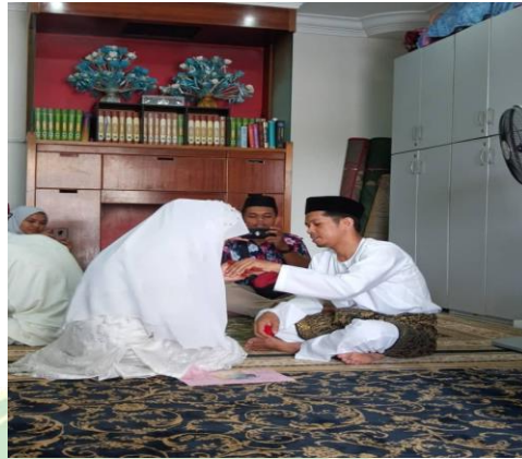
Program walimatul ursi