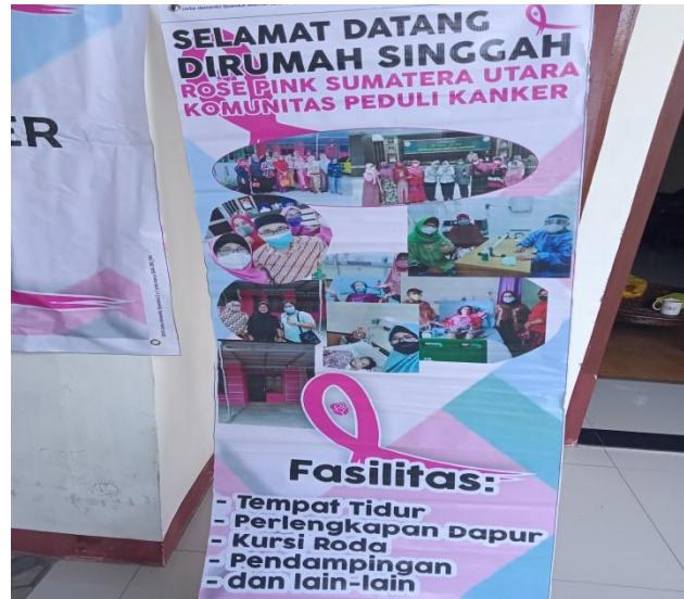
Lampiran 5. Kunjungan Rose Pink Ke Rumah Pasien Penyakit Kanker