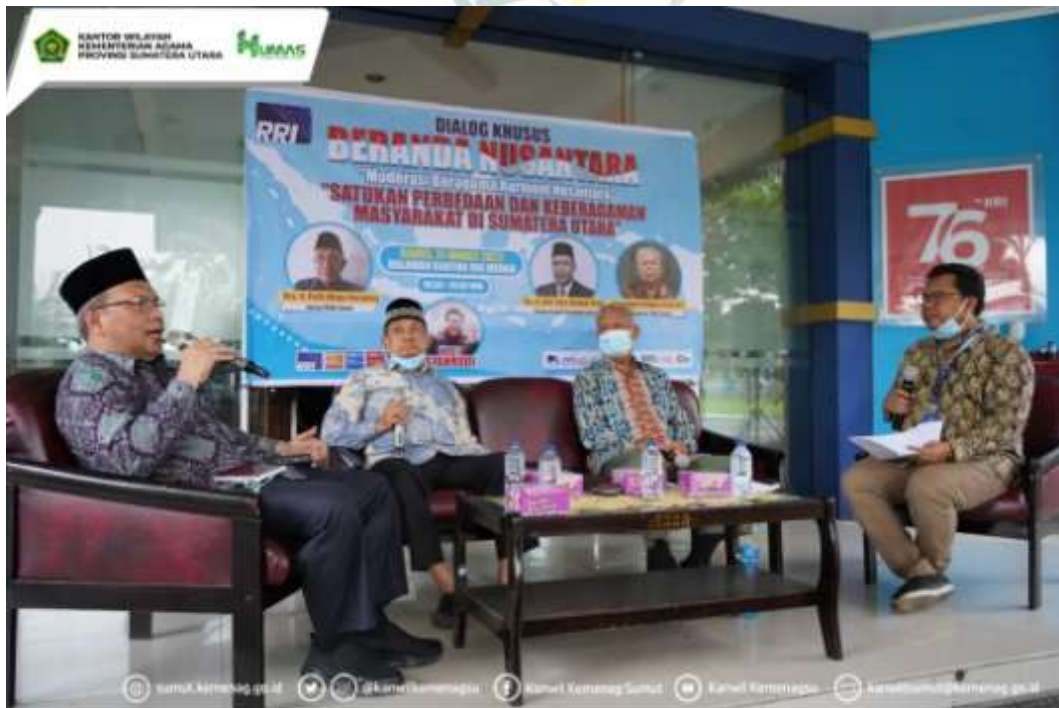
Ket : Dialog Khusus Beranda Nusantara yang dilaksanakan oleh Radio Republik Indonesia (RRI) Medan dengan kepala Kanwil Kemenag Sumut sebagai salah satu pemateri.