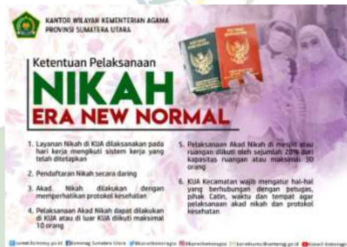
Ket : Inforgrafis yang dipublikasikan di website Kanwil Kemenag Sumut.