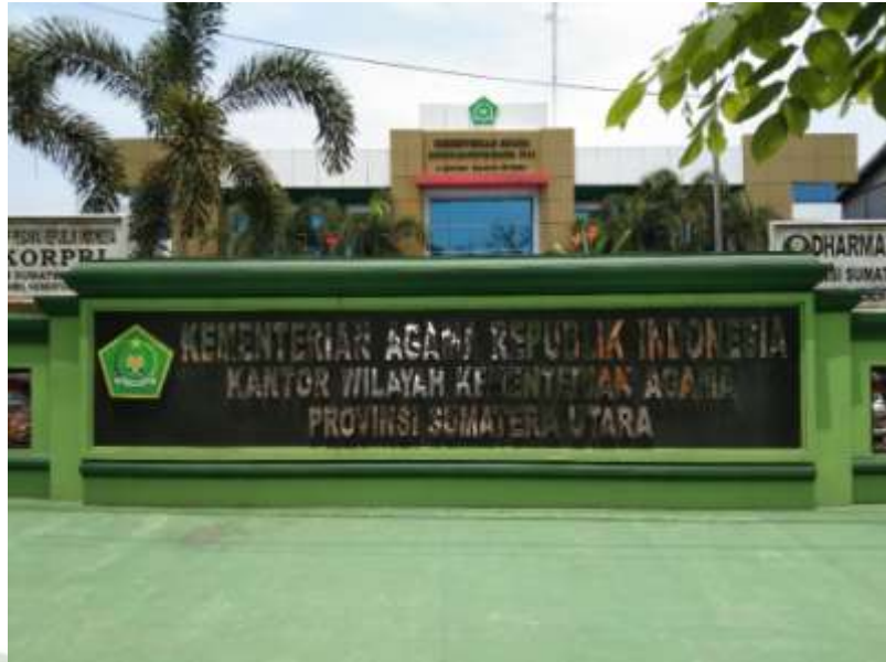
Ket: Foto Kantor Wilayah Kementerian Agama Sumatera Utara tampak dari depan.