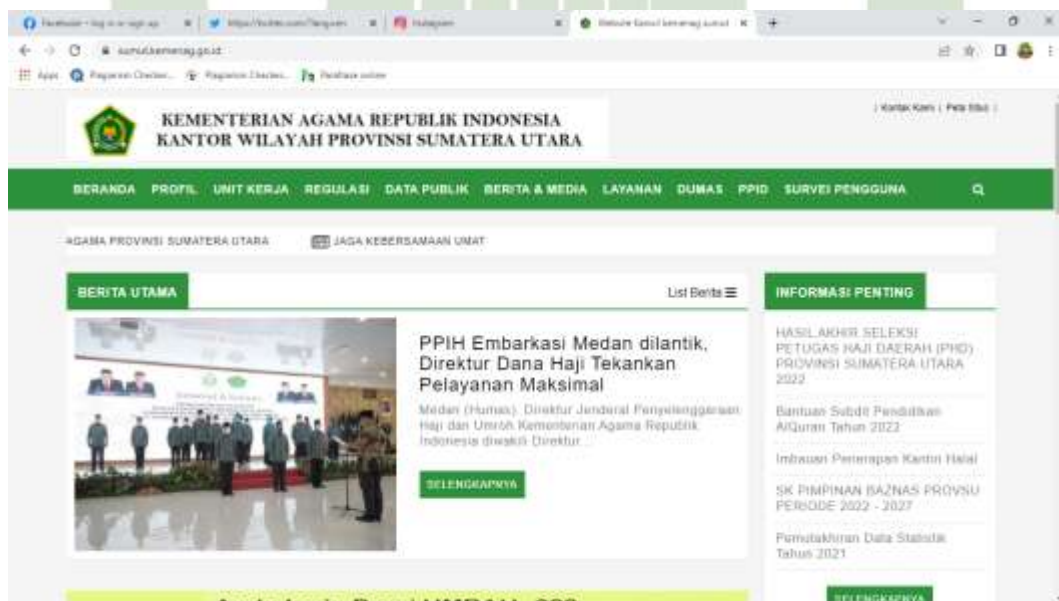
Ket: Halaman depan website Kanwil Kemenag Sumut.