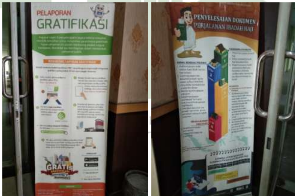
Ket : Foto Flyer Informasi yang berada diruang depan Kanwil Kemenag Sumut.