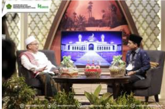
Ket : Kepala Kanwil Kemenag Sumut menjadi pemateri dalam program acara Marhaban ya Ramadhan di TVRI Medan