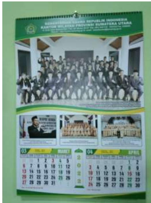
Ket : Foto Kalender Kanwil Kemenag Sumut.