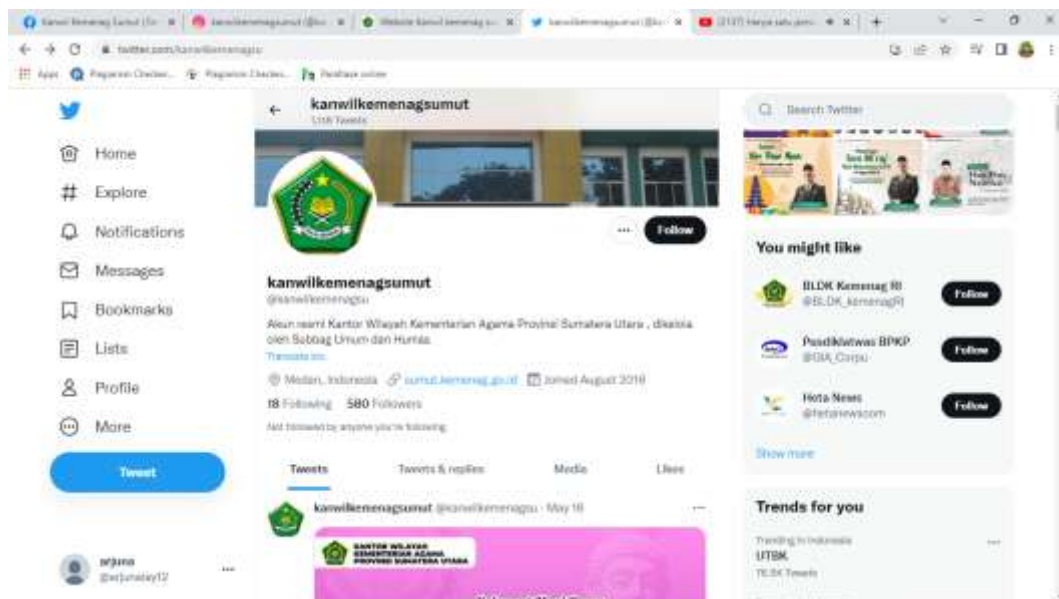
Ket: Halaman beranda Twitter Kanwil Kemenag Sumut.