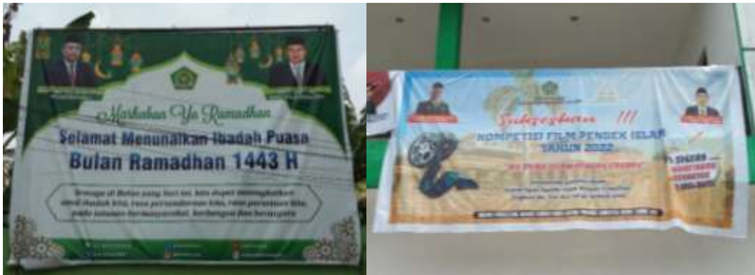
Ket : Foto Spanduk Ucapan dan pemberitahuan yang berada di halaman depan Kanwil Kemenag Sumut.