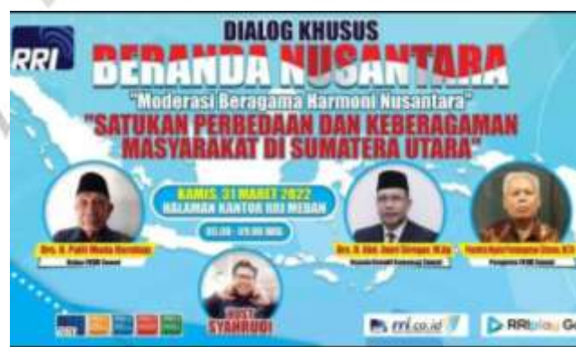
Ket : Poster Jadwal siaran RRI Medan Kanwil Kemenag Sumut.