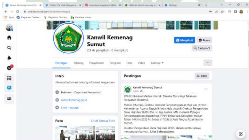
Ket : Halaman beranda Facebook Kanwil Kemenag Sumut.