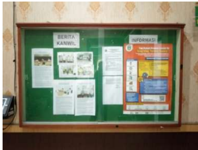
Ket : Foto Papan Informasi yang berada di ruang depan Kanwil Kemenag Sumut