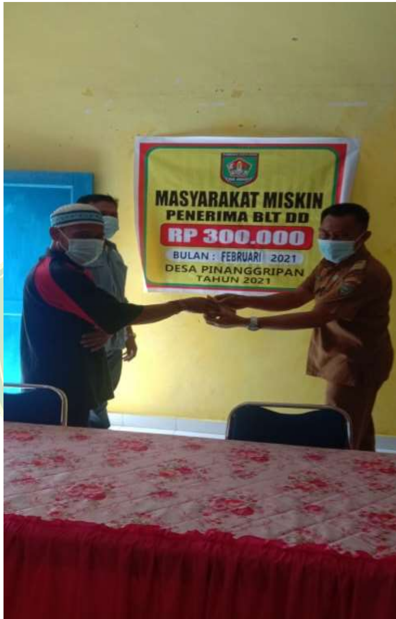
Gambar 5.10 Foto Dokumentasi Bantuan Sosial