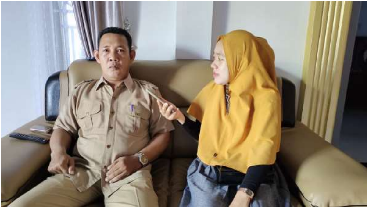
Gambar 5.7 Wawancara dengan Informan V

Lokasi Wawancara : Di Rumah Informan Dusun II Pinanggripan