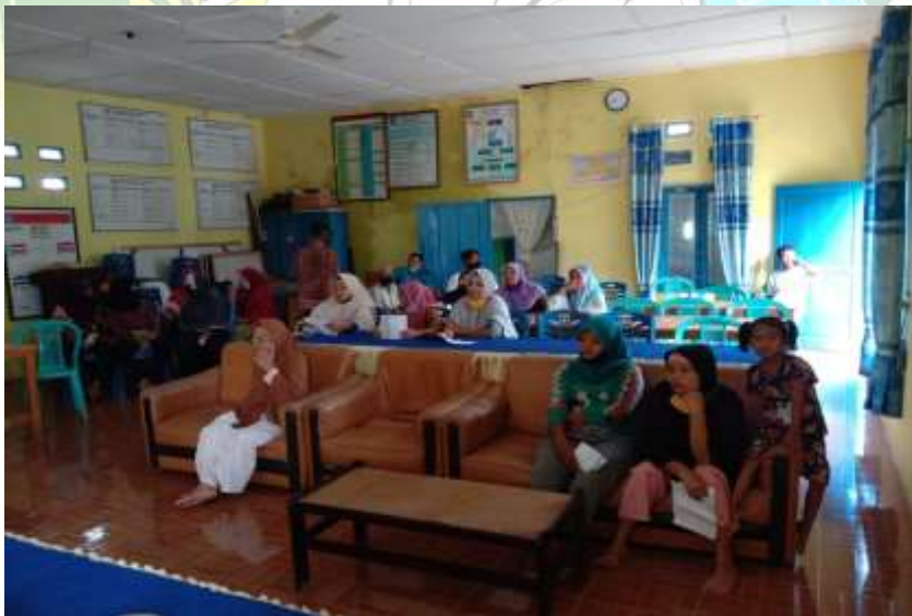
Gambar 5.9 Foto dokumentasi sosialisasi bansos