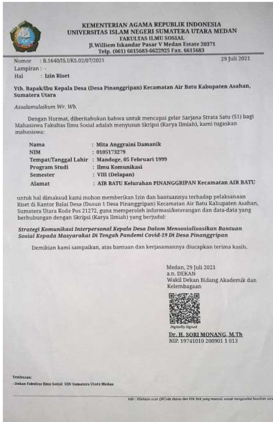
Gambar 5.1 Surat Izin Riset