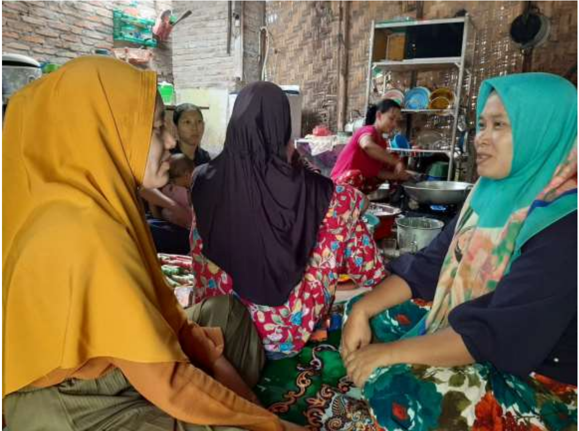
Gambar 5.6 Wawancara dengan Informan IV

Lokasi Wawancara : Di Rumah Informan Dusun II Pinanggripan