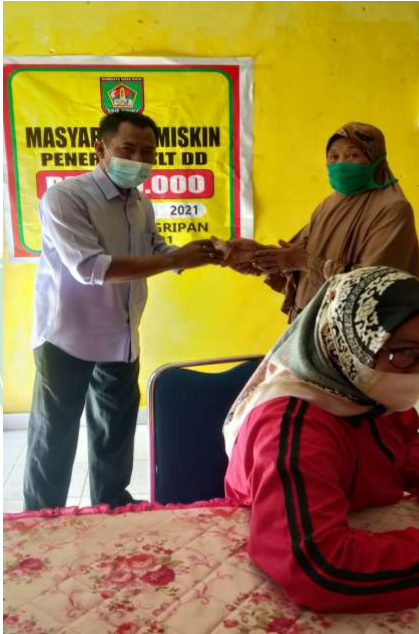
Gambar 5.10 Foto Dokumentasi Bantuan Sosial