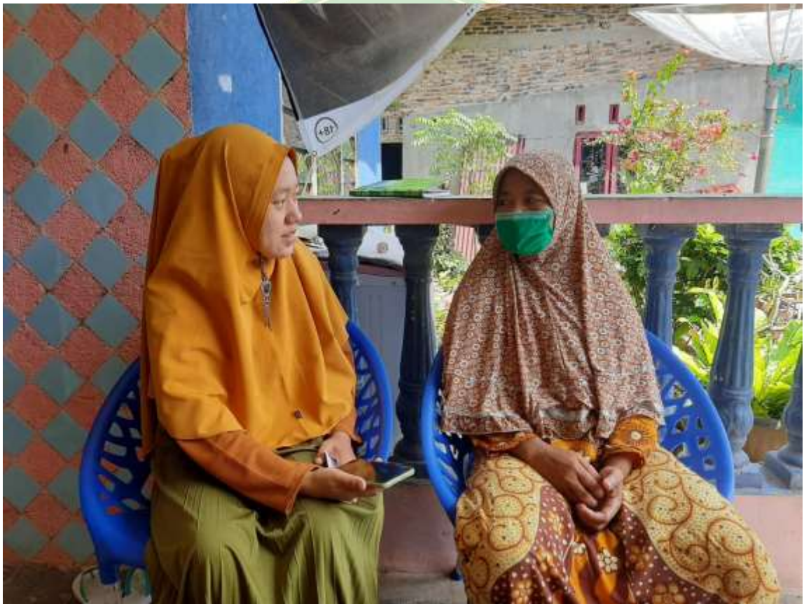
Gambar 5.3 Wawancara dengan Informan I

Lokasi Wawancara : Di Rumah Informan Dusun I Pinangripan