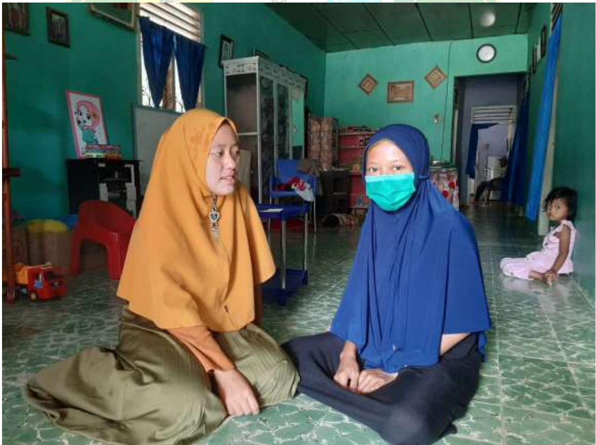
Gambar 5.4 Wawancara dengan informan II

Lokasi Wawancara : Di Rumah Informan Dusun III Pinanggripan