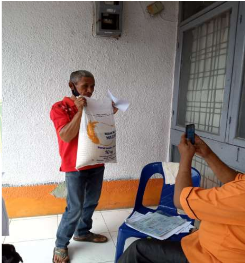
Gambar 5.10 Foto Dokumentasi Bantuan Sosial