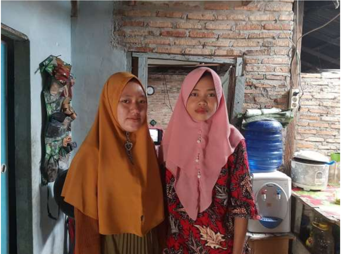
Gambar 5.5 Wawancara dengan informan III