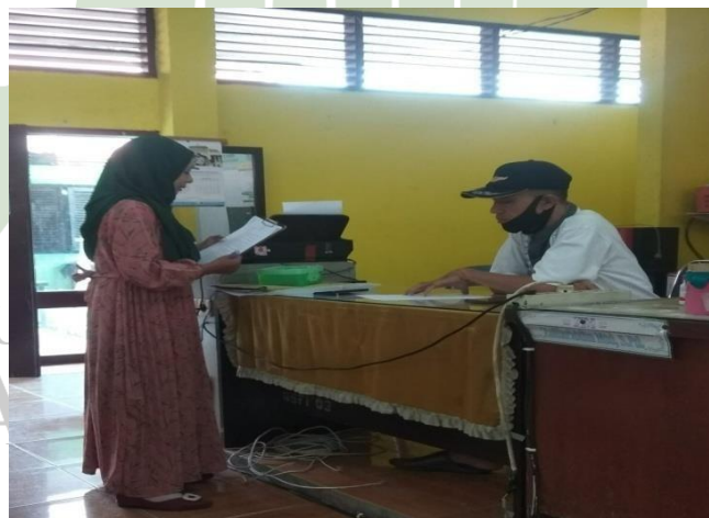
WAWANCARA WAKA KURIKULUM