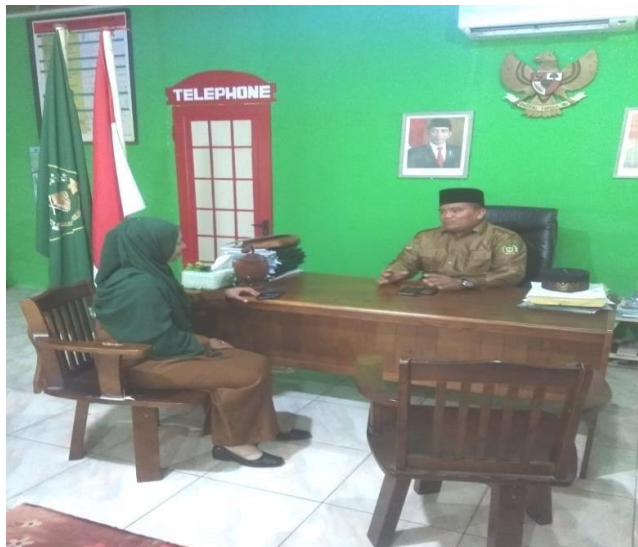
WAWANCARA KEPALA MADRASAH