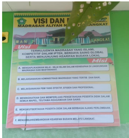
VISI DAN MISI