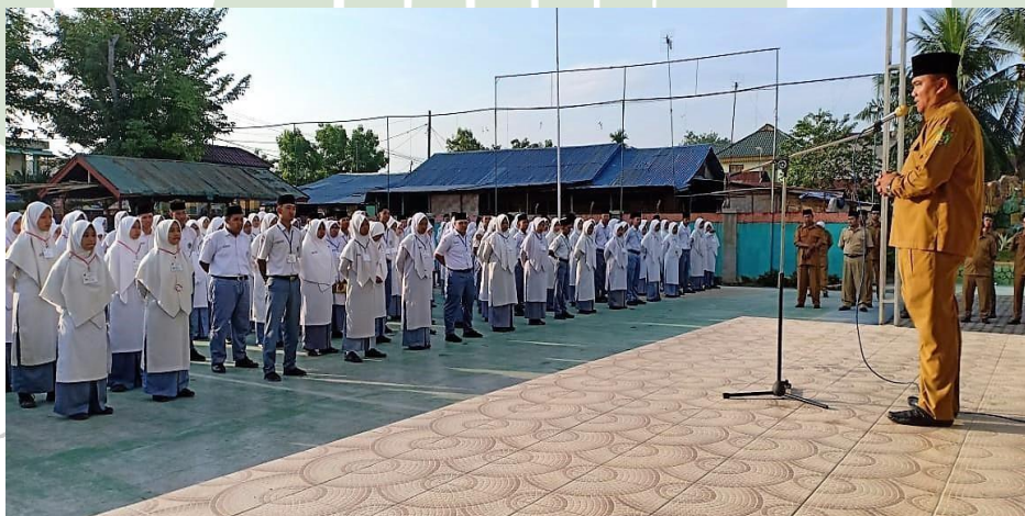
KEGIATAN UPACARA RUTIN HARI SENIN