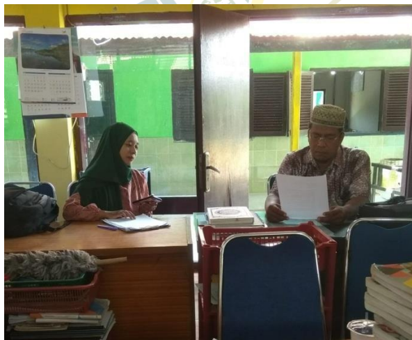
WAWANCARA WAKA SARPRAS