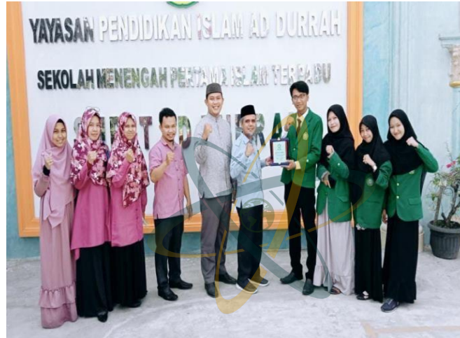
Gambar. 5: Foto bersama Staff Administrasi SMP IT (Islam Terpadu) Ad-Durrah Medan Marelan