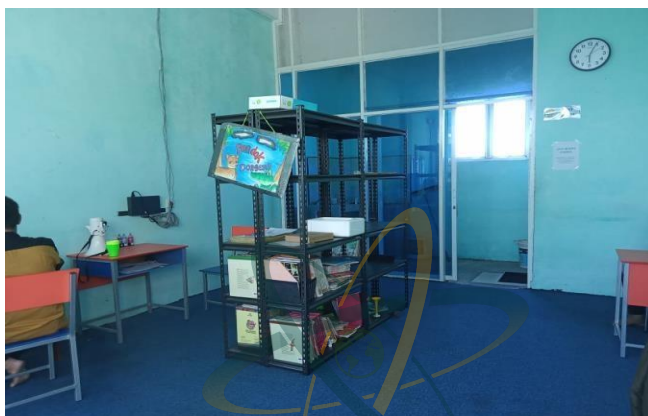
Gambar. 24: Ruang Lab Sekolah SMP IT (Islam Terpadu) Ad-Durrah Medan Marelan