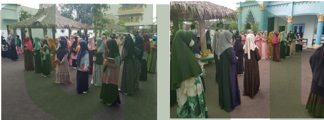
Gambar. 28: Proses Belajar Mengajar di Sekolah SMP IT (Islam Terpadu) Ad-Durrah Medan Marelان