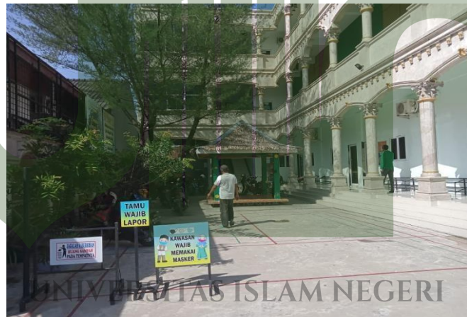
Gambar. 10: Tumbuhan SMP IT (Islam Terpadu) Ad-Durrah Medan Marelan