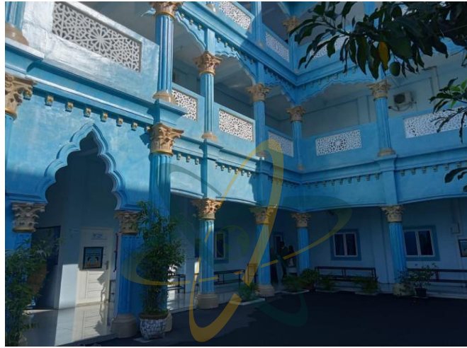
Gambar. 9: Gedung Kelas B SMP IT (Islam Terpadu) Ad-Durrah Medan Marelan