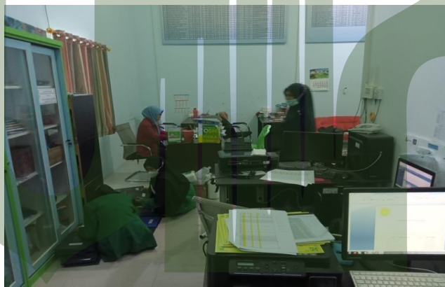
Gambar. 22: Ruang Keuangan Yayasan Sekolah SMP IT (Islam Terpadu) Ad-Durrah Medan Marelan