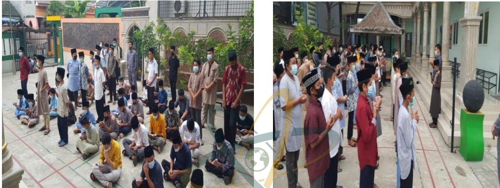
Gambar. 27: Apel Pagi dan Doa Bersama di Gedung Wanita Sekolah SMP IT (Islam Terpadu) Ad-Durrah Medan Marelان