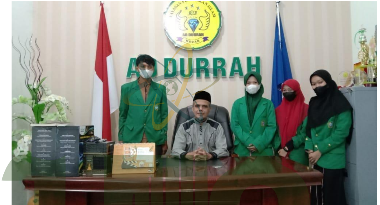
Gambar. 7: Halaman Depan SMP IT (Islam Terpadu) Ad-Durrah Medan Marelan