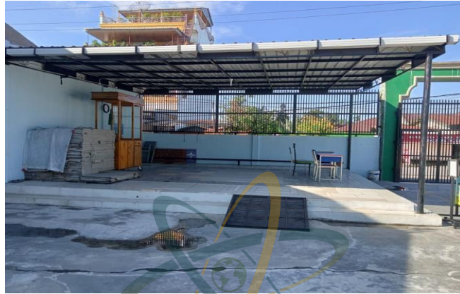
Gambar. 12: Lapangan Serbaguna SMP IT (Islam Terpadu) Ad-Durrah Medan Marelan