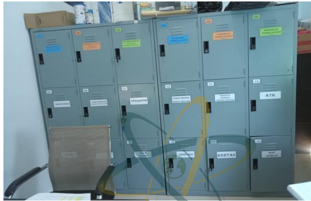
Gambar. 21: Ruang Tata Sekolah SMP IT (Islam Terpadu) Ad-Durrah Medan Marelan