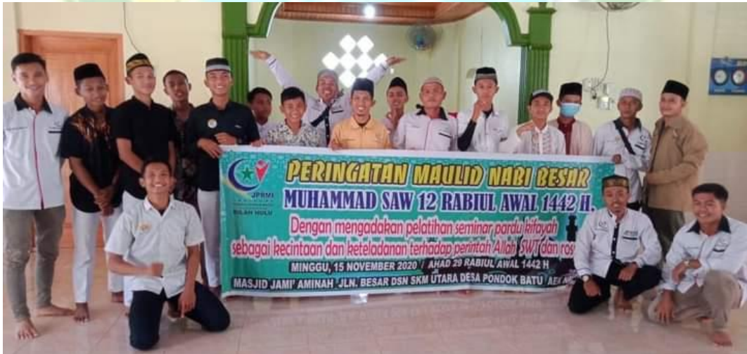
Peringatan Maulid Nabi Muhammad Saw