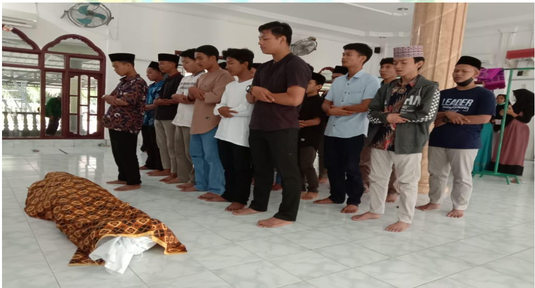
Pelatihan Fardhu Kifayah JPRMI Kabupaten Labuhanbatu