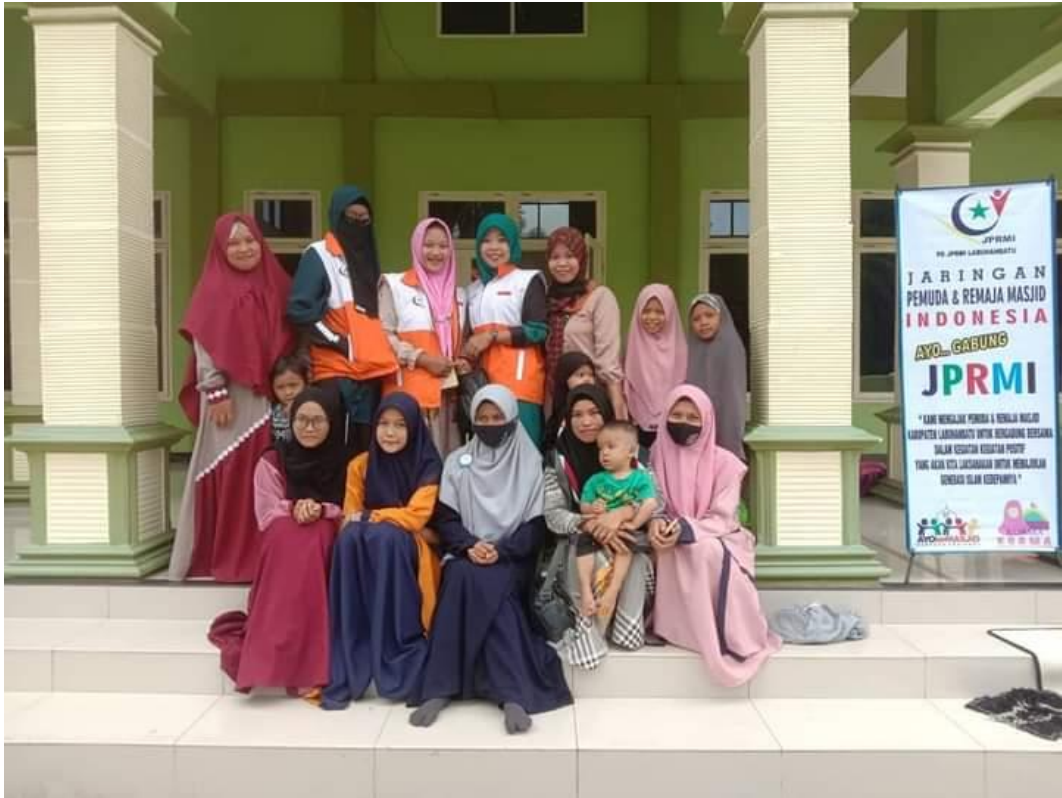
Komunitas Remaja Muslimah JPRMI Kabupaten Labuhanbatu