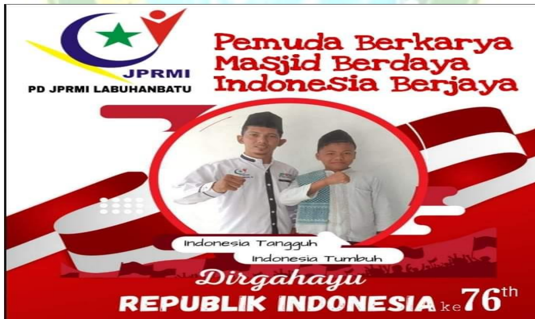
Twibbon Hari Kemerdekaan RI JPRMI Kabupaten Labuhanbatu