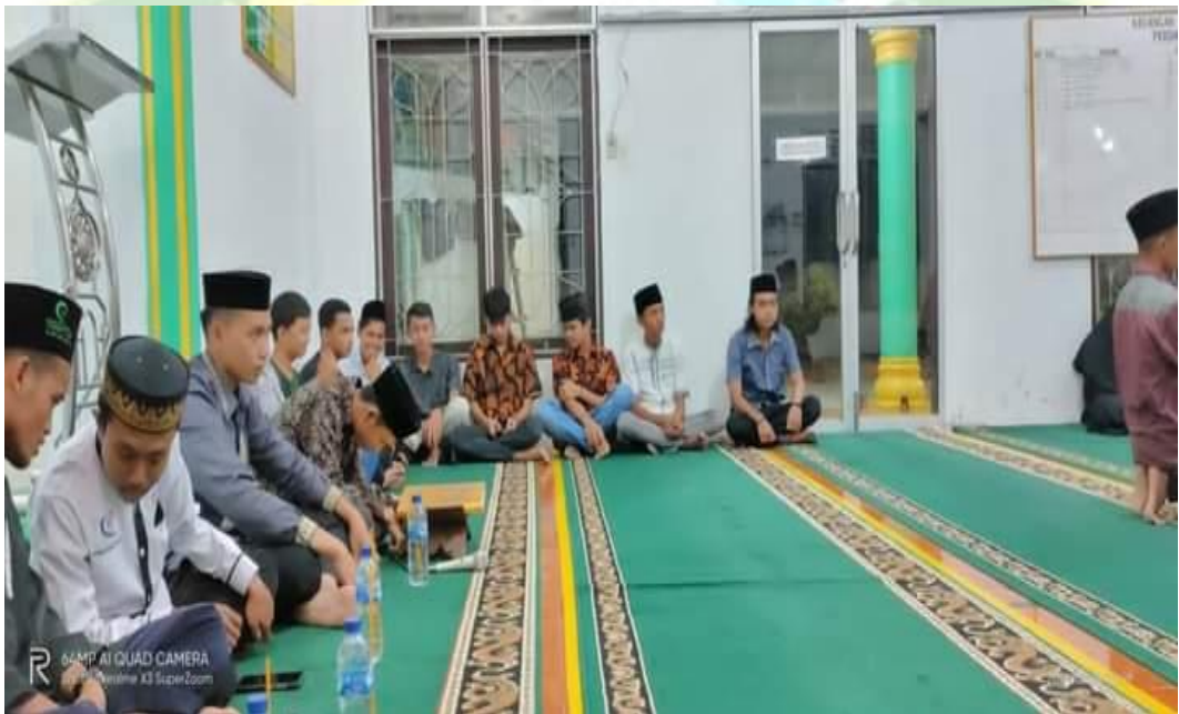
Kegiatan SULING (Subuh Keliling) JPRMI Kabupaten Labuhanbatu