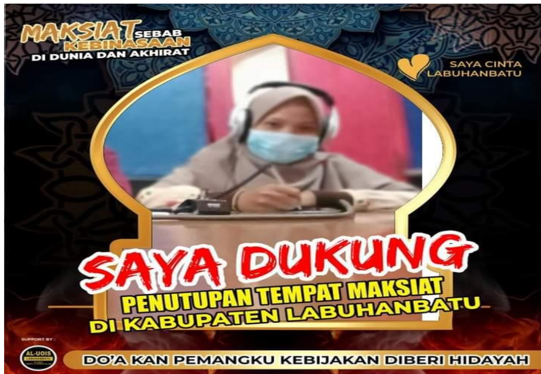
Gerakan Penutupan Tempat Maksiat oleh PD JPRMI Kabupaten Labuhanbatu