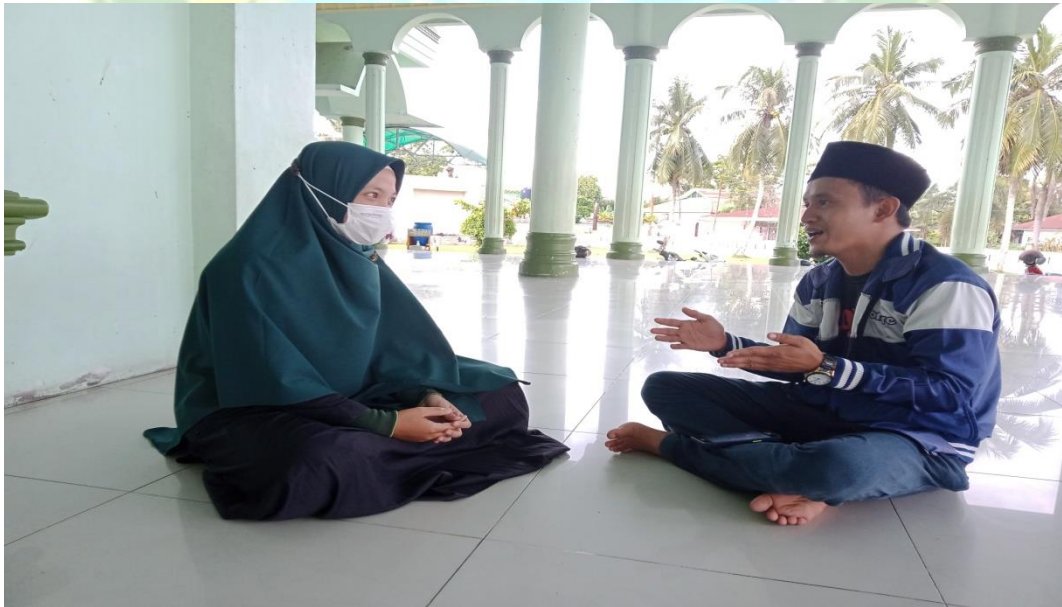
Wawancara dengan Sekretaris Umum JPRMI Kabupaten Labuhanbatu