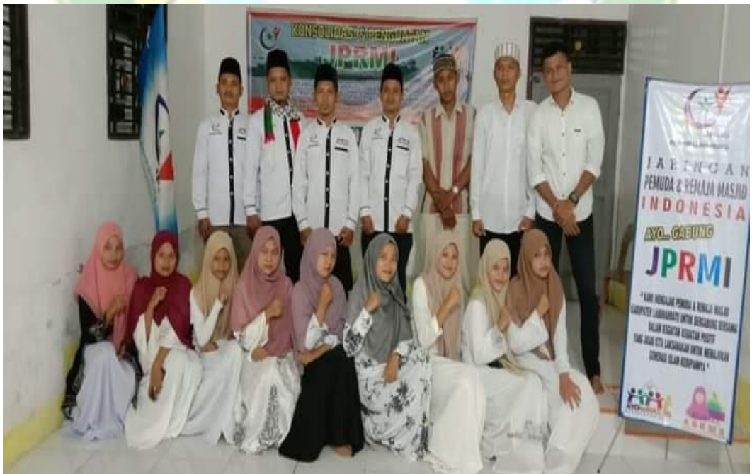
Sosialisasi Gerakan Nasional Ayo Ke Masjid