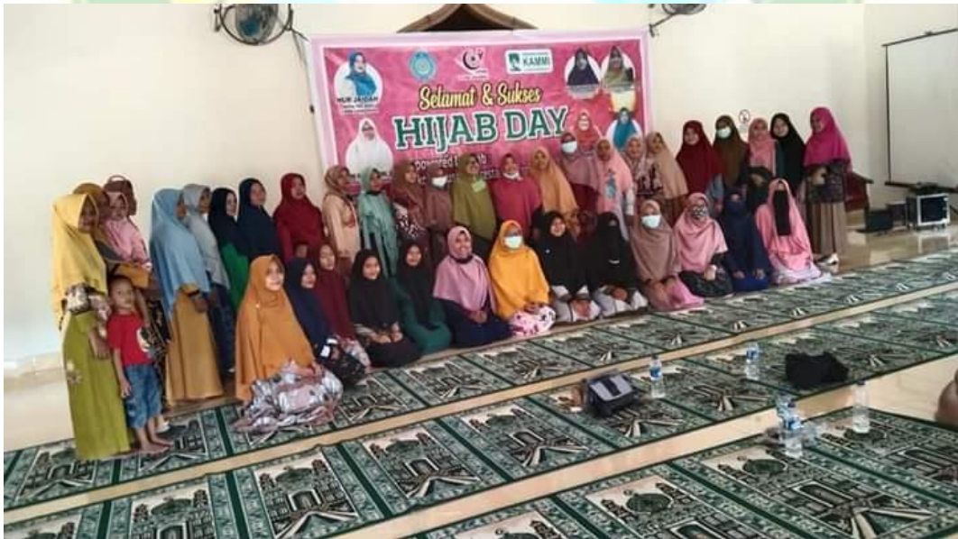
Peringatan Hari Hijab Sedunia KORMA JPRMI Kabupaten Labuhanbatu