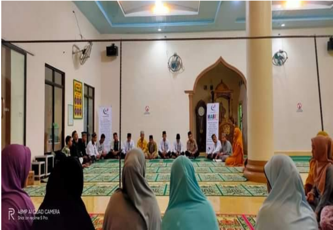
Kegiatan MABIT JPRMI Kabupaten Labuhanbatu