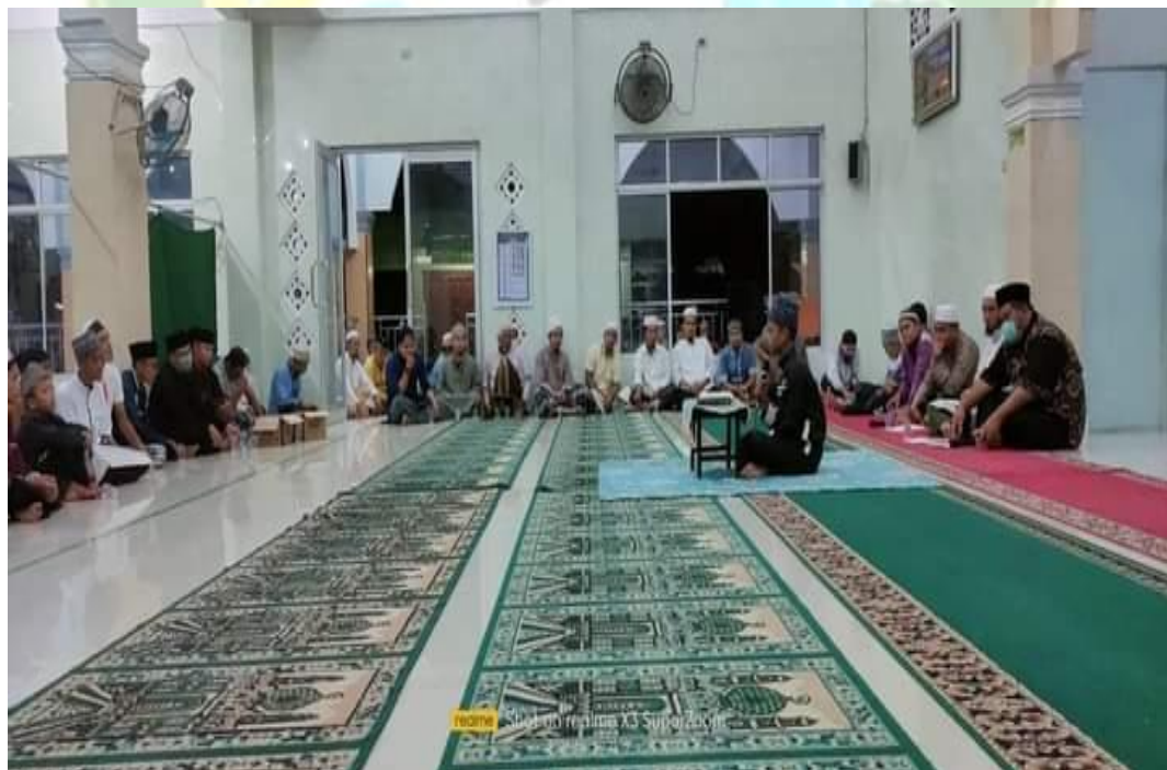
Peringatan Malam Nuzulul Quran PD JPRMI Kabupaten Labuhanbatu