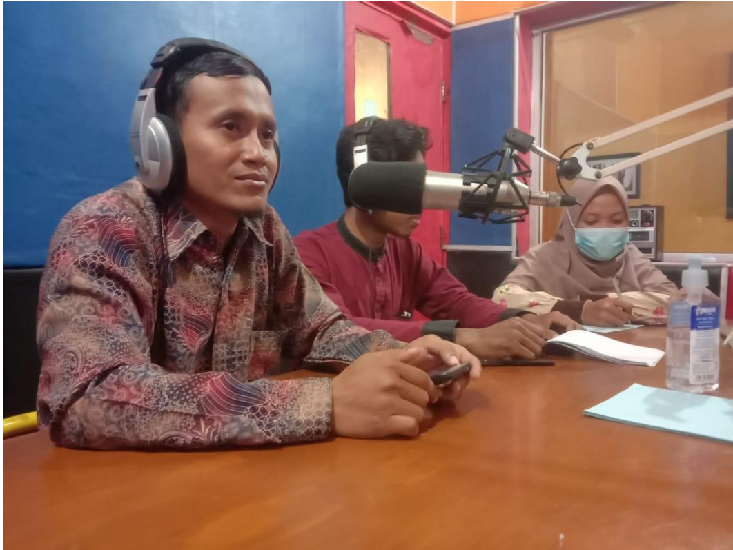
Kegiatan Pengisian Ceramah Ramadhan di Radio PAS FM Rantauprapat