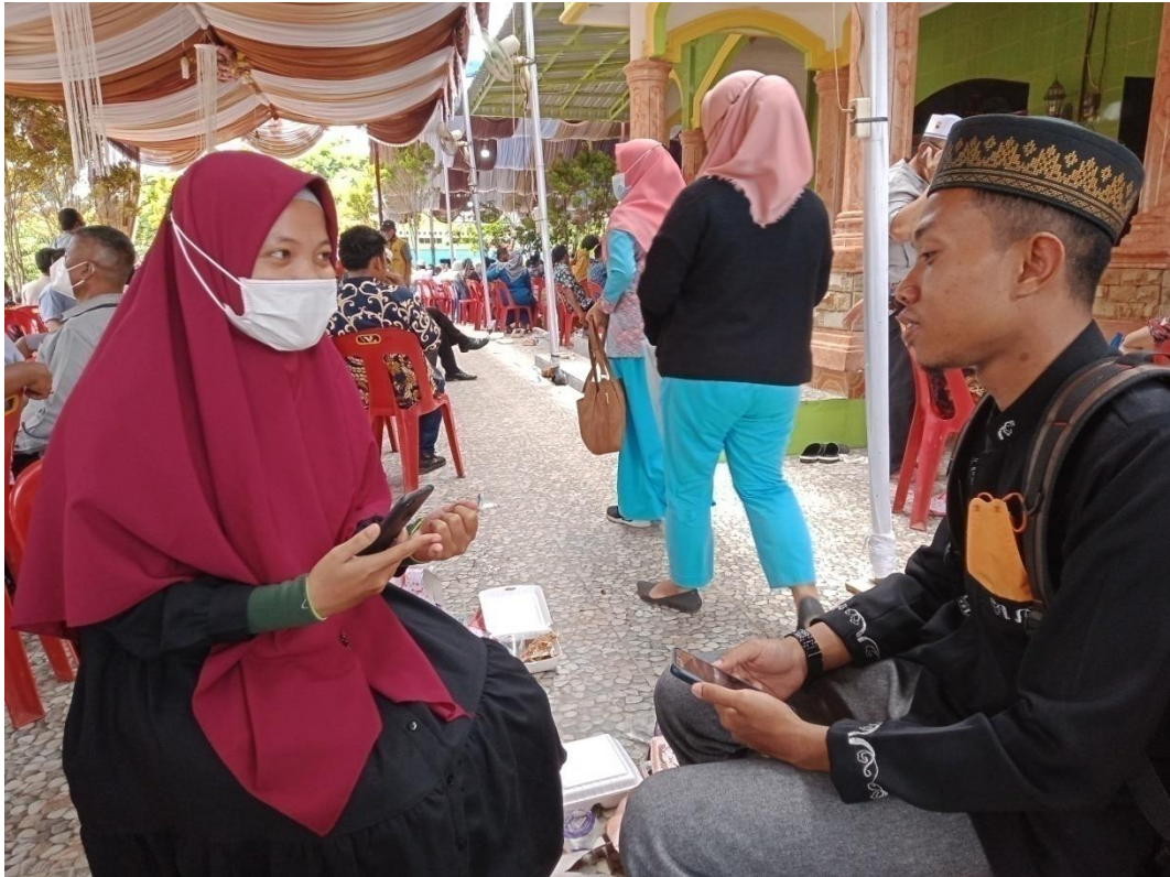
Wawancara dengan Ketua Bidang Syiar dan Dakwah JPRMI Labuhanbatu