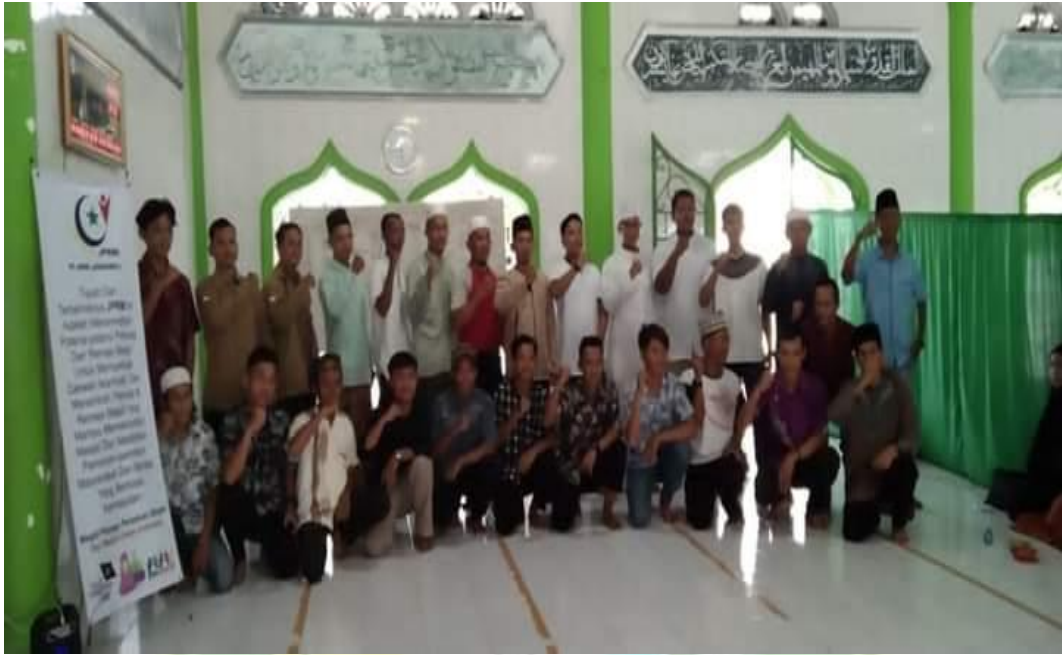
Pelatihan Manajemen Masjid