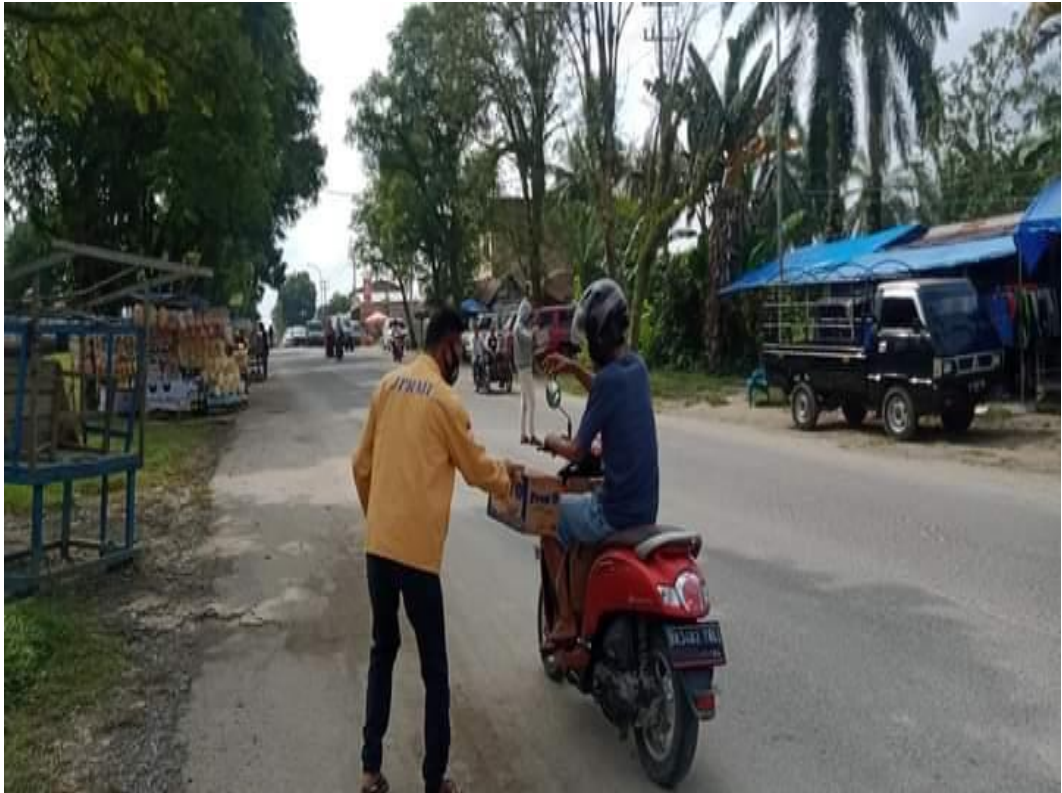
Aksi Galang Dana Peduli Sulawesi JPRMI Kabupaten Labuhanbatu