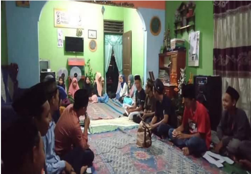
Kegiatan SIRAM (Silaturahmi Remaja Masjid) JPRMI Kabupaten Labuhanbatu