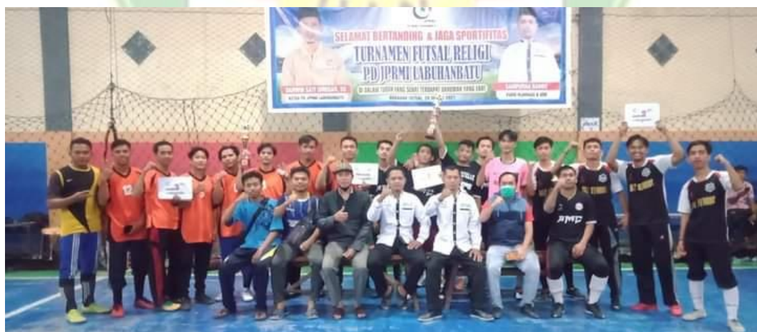
Futsal Religi JPRMI Kabupaten Labuhanbatu

Gerakan Tolak Legalisasi Miras Melalui Twibbon JPRMI Labuhanbatu