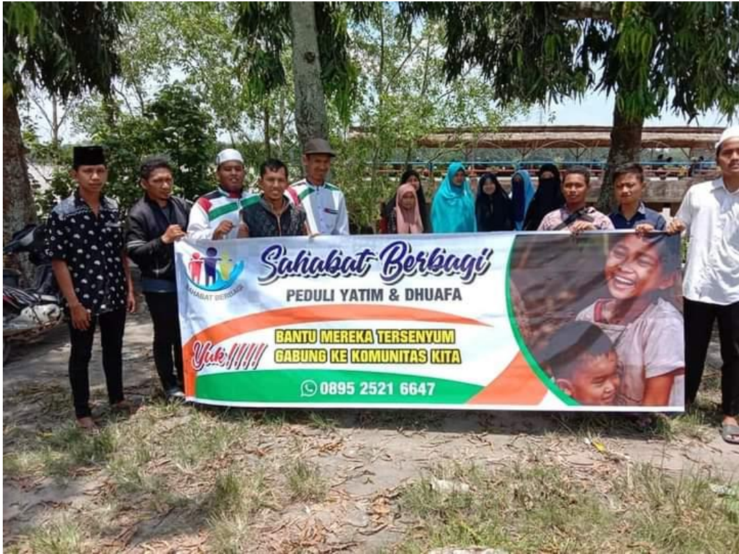
Kegiatan Taruna Masjid JPRMI Sahabat Berbagi