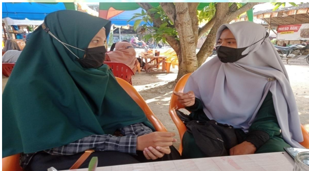
Wawancara dengan salah satu Khalayak Kabupaten Labuhanbatu