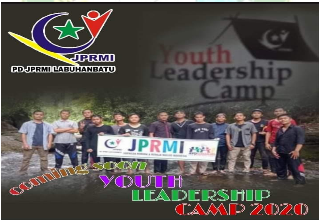
Kegiatan Kemah Dakwah JPRMI Kabupaten Labuhanbatu