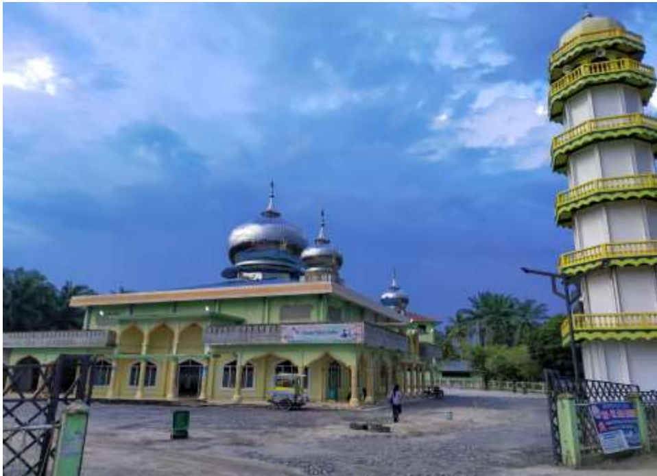
Tampak masjid dari samping (jalan lintas)