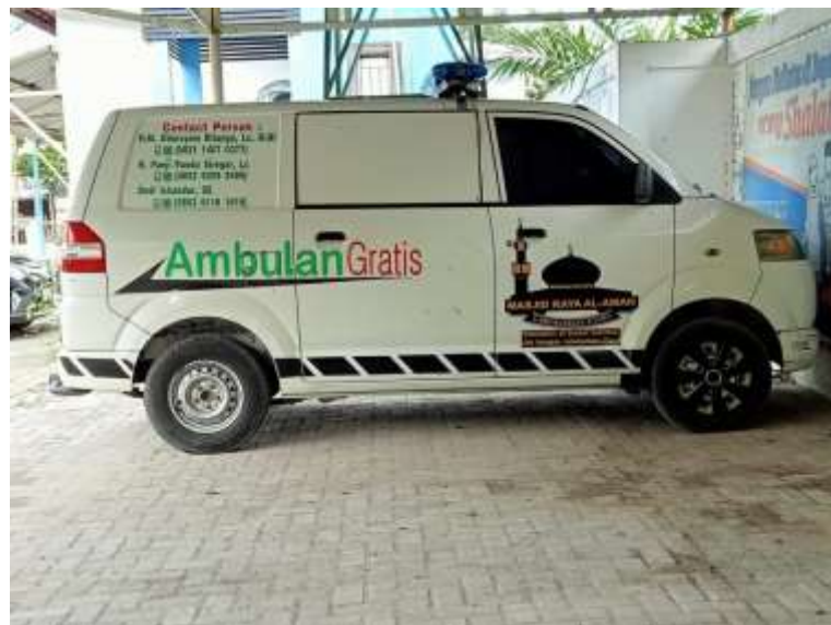
Ambulan Gratis Masjid Raya Al Aman Aek Kanopan