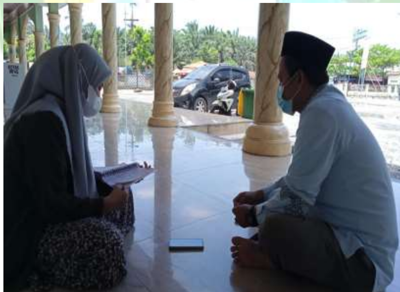
Dokumentasi hasil wawancara dengan Sekretaris BKM Al Aman Aek Kanopan