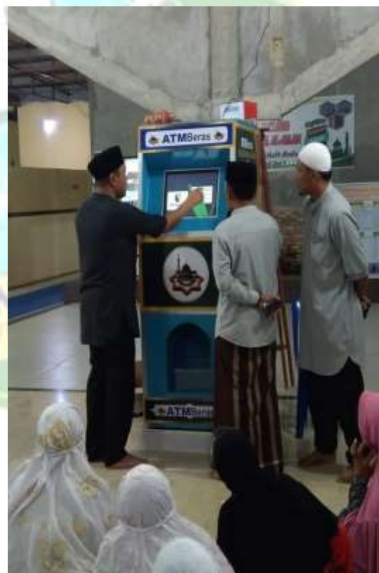
Atm Beras yang akan diberikan kepada masyarakat yang berhak menerima.