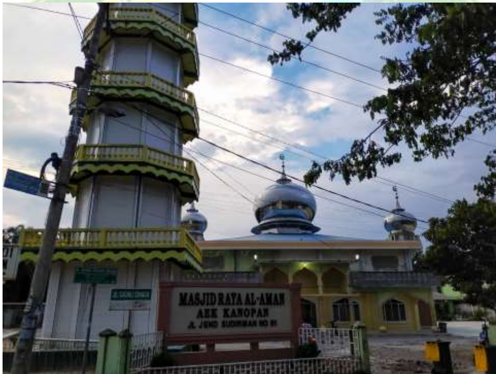
Tampak masjid dari depan