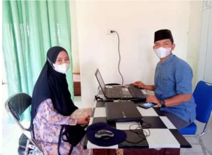
Dokumentasi hasil wawancara dengan Ketua BKM Al Aman Aek Kanopan