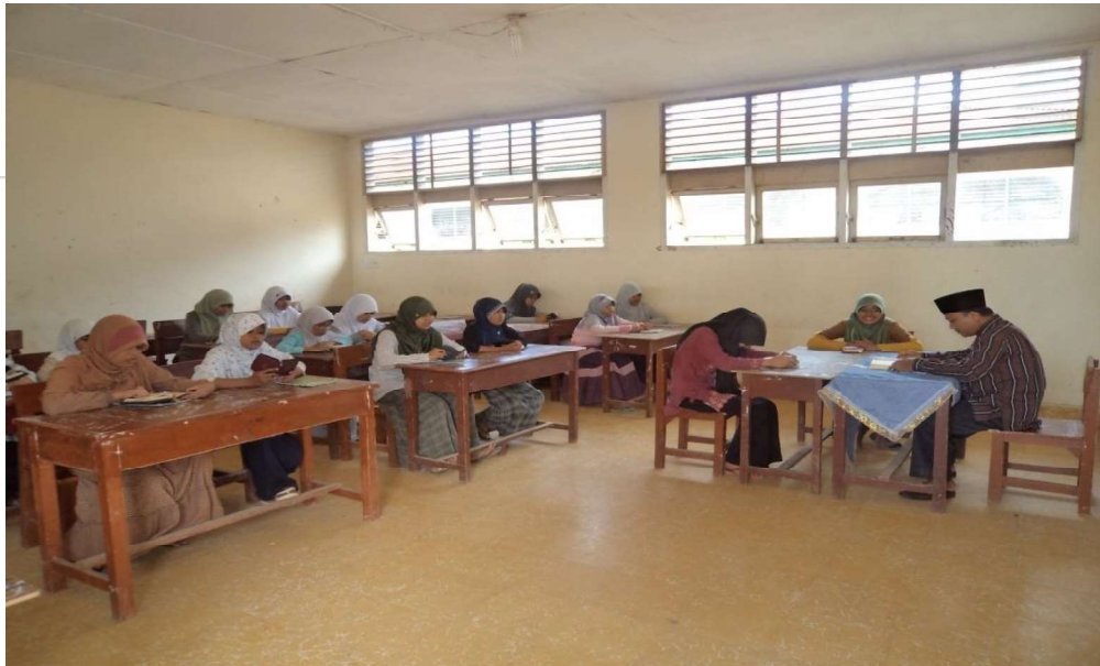
Proses Tahfizil Qur'an sebagai wadah pengembangan diri dan kompetensi siswa