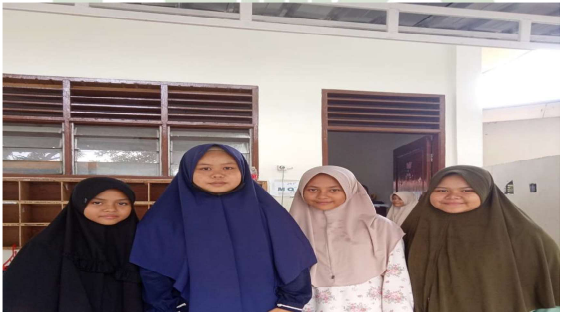
Santri Madrasah Tsanawiyah Hifzhil Quran