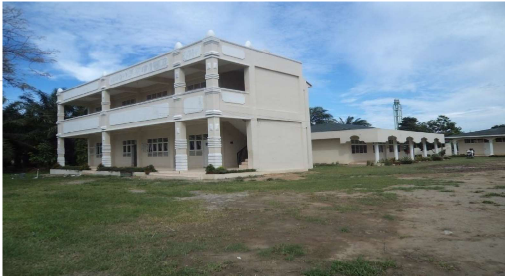
Bangunan Lokal MTs Hifzil Qur'an