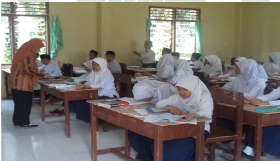
Proses Belajar dan Mengajar di MTs Hifzil Quran