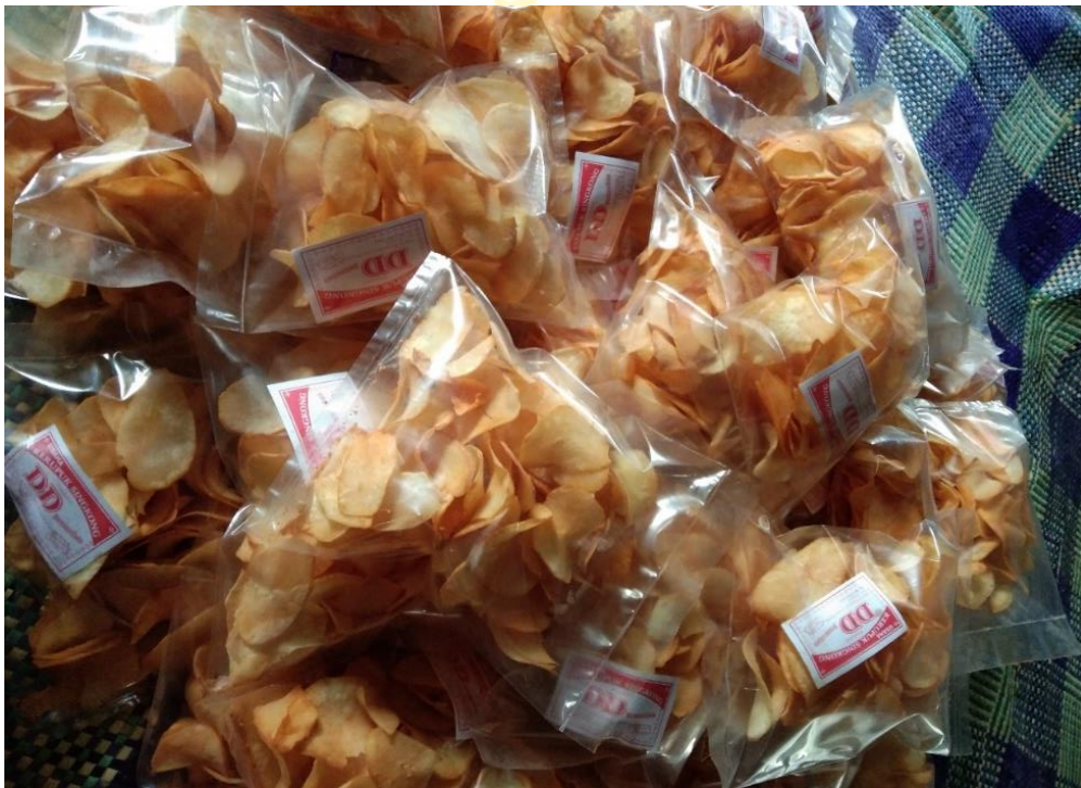
Contoh Produk Olahan Kripik Singkong Home Industri DD Bersaudara