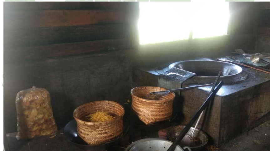
Tempat Pengolahan Kripik Singkong DD Bersaudara