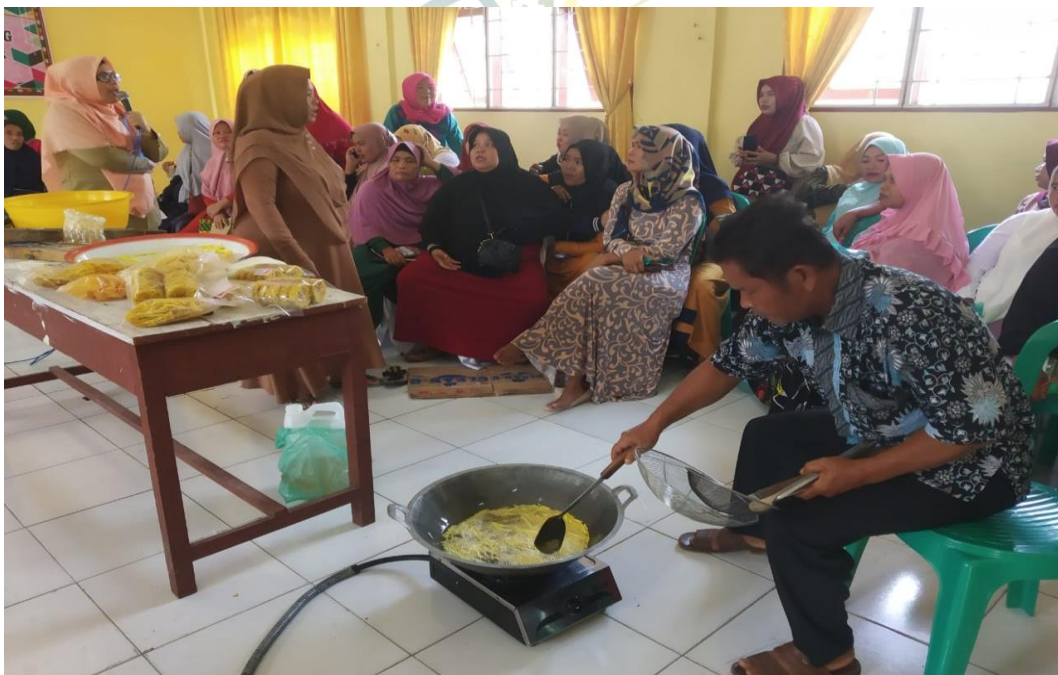
Foto Home Industri DD Bersaudara Menjadi Narasumber Dalam Kegiatan Pelatihan

“Peningkatan Keterampilan Perempuan Melalui Pelatihan Pembuatan Kripik