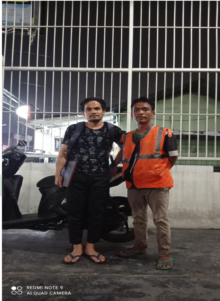
Foto bersama salah satu petugas parkir khusus di Desa Tembung