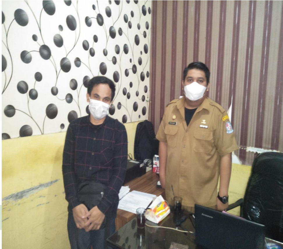
Foto bersama Kepala Seksi Ketentraman dan Ketertiban Kecamatan Percut Sei Tuan

UNIVERSITAS ISLAM NEGERI SUMATERA UTARA MEDAN