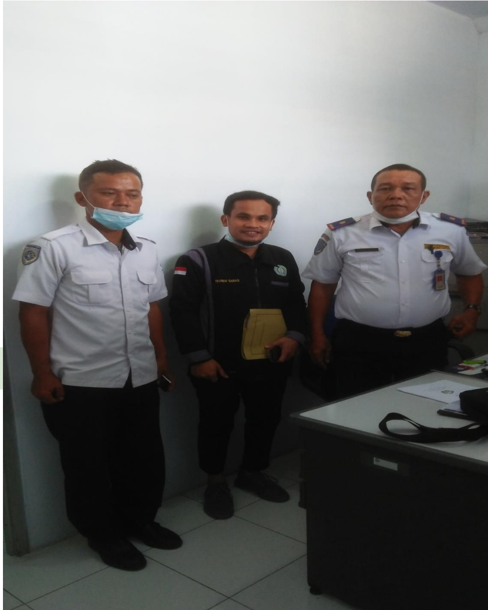
Foto bersama Kepala Seksi Pengoperasian dan Prasarana Dishub Deli Serdang