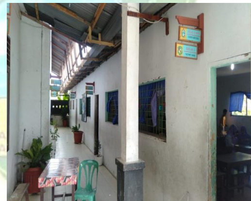
Foto Ruang Kelas SMAS PGRI 12 Medan