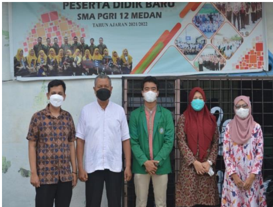
Foto Bersama Informan SMAS PGRI 12 Medan