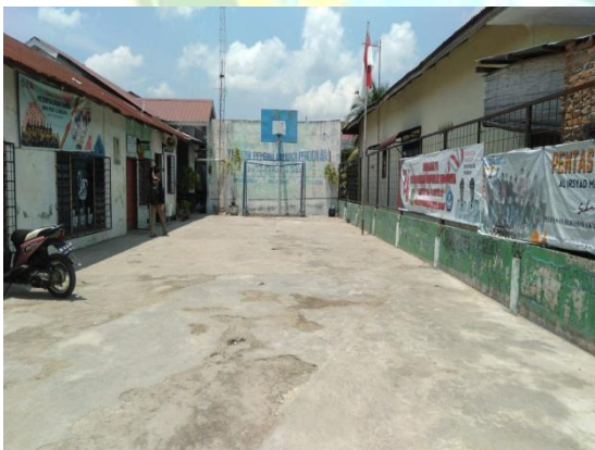
Halaman Depan Sekolah SMAS PGRI 12 Medan