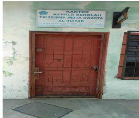
Ruang Kepala sekolah dan Guru Sekolah SMAS PGRI 12 Medan