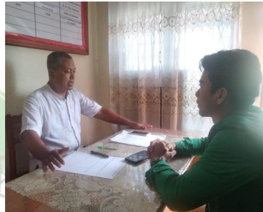
Wawancara dengan bapak kepala sekolah SMAS PGRI 12 Medan