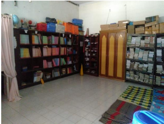
Perpustakaan sekolah SMAS PGRI 12 Medan