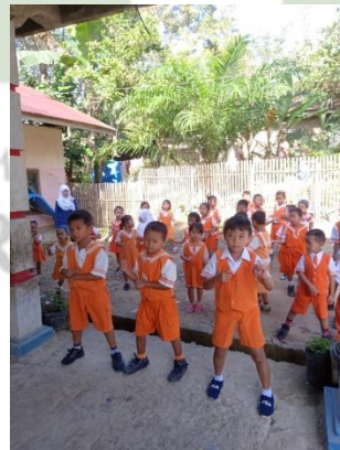
Gambar : kegiatan olahraga senam agar sehat.