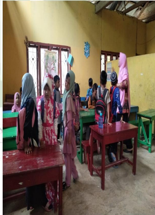
Gambar: proses pembelajaran berlangsung