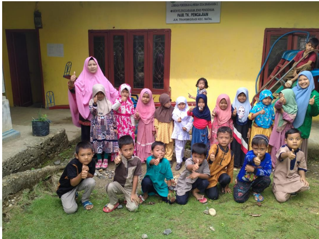
Gambar : foto bersama anak-anak PAUD Al-Hikmah Desa Sikara-kara I

UNIVERSITAS ISLAM NEGERI SUMATERA UTARA MEDAN