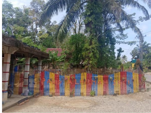
Gambar : Tampak depan dan lingkungan PAUD Al-Hikmah Desa Sikara-kara I