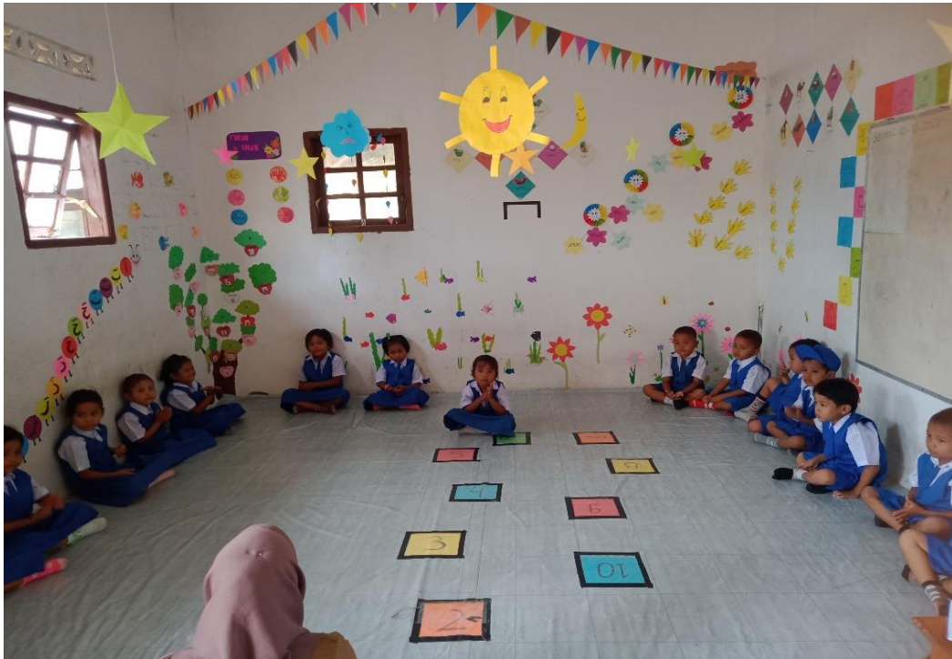
Poto saat melakukan observasi awal pada kelas kontrol