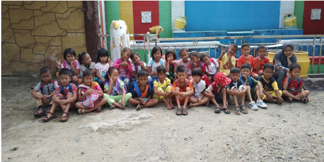
Poto pada saat melakukan observasi akhir dengan metode karyawisata