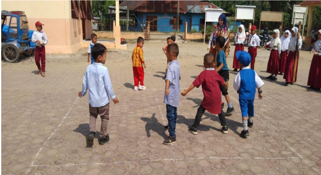
Poto saat melakukan pembelajaran di luar kelas