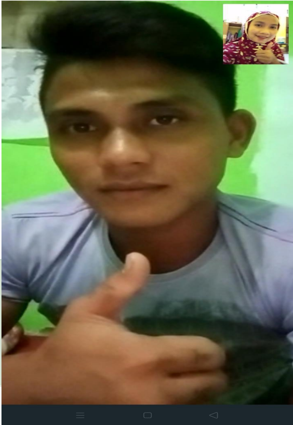
Gambar. Bersama Binaan Muallaf Al Muhajirin Bumi Asri Medan (