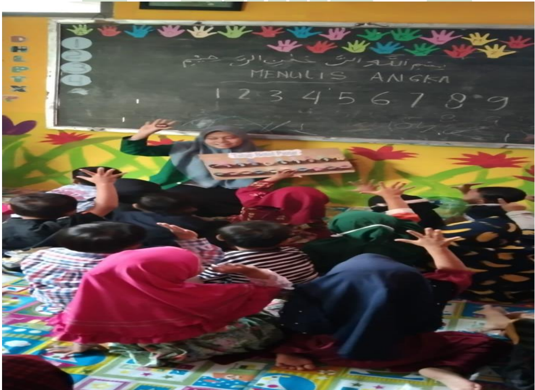
Belajar Mengenal Konsep Sama, Lebih Banyak dan Lebih Sedikit