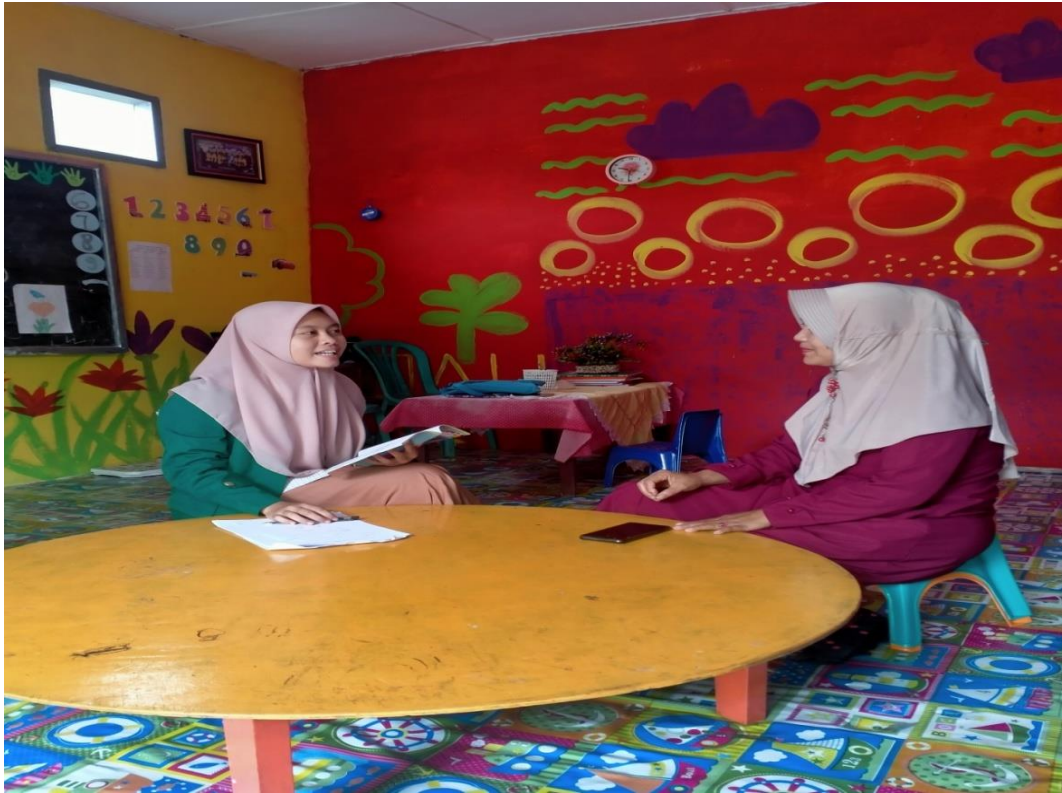
Kegiatan Wawancara dengan Guru Kelas Kelompok B PAUD Pelangi