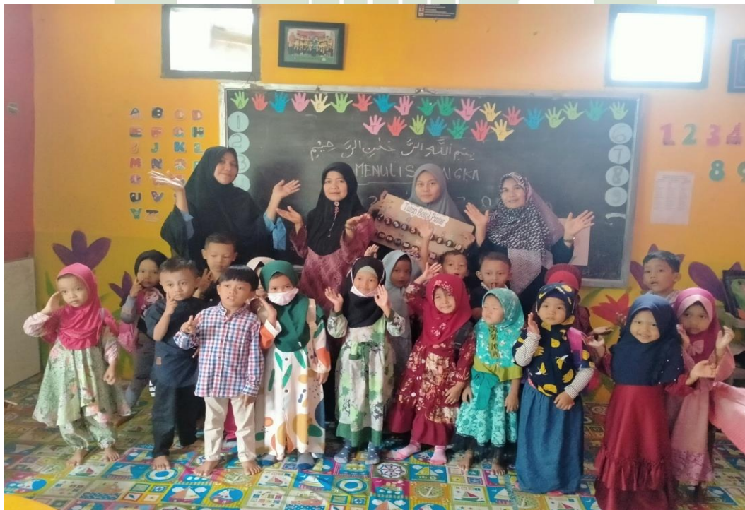
Foto dengan Guru dan Murid PAUD Pelangi Kelas Kelompok B