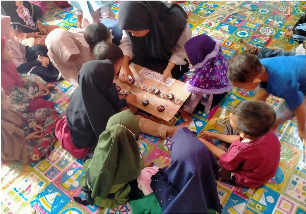
Mencocokkan Angka Sesuai dengan Tutup Botol Pintar