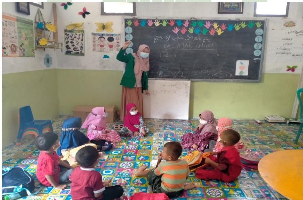
Melihat Kemampuan Anak dalam Menyebutkan Angka 1-20