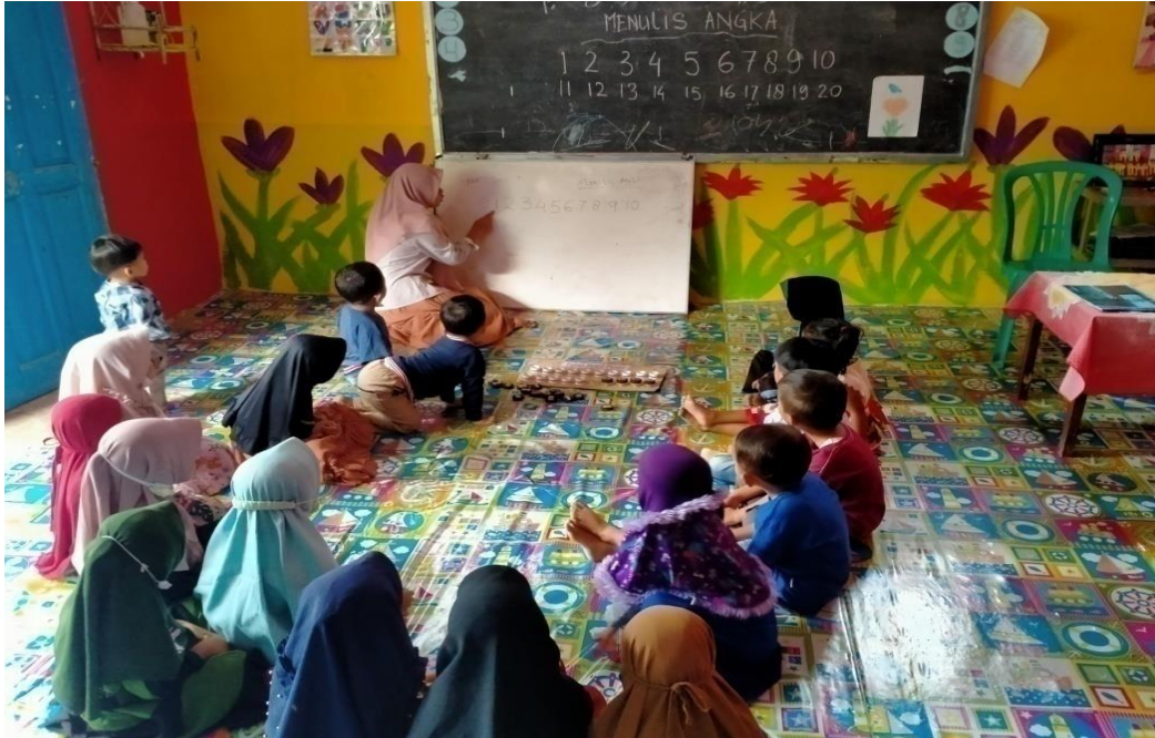
Melihat Kemampuan Anak dalam Mengenal Lambang Bilangan