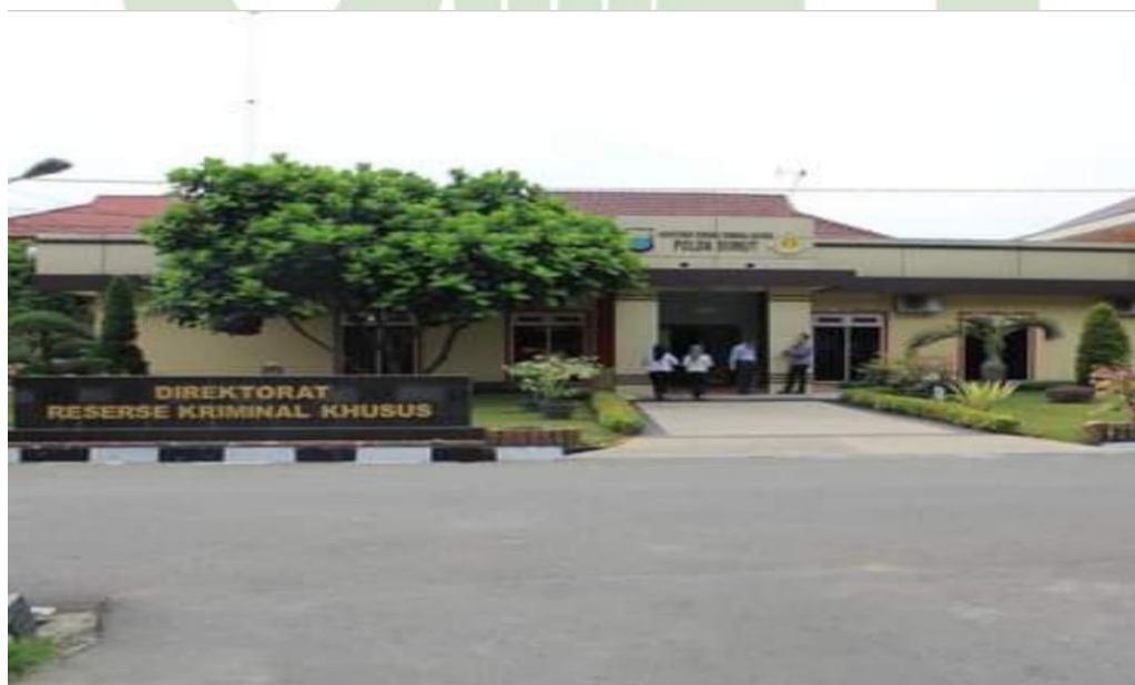
Gambar. 2 Lokasi Penelitian Ditreskrimsus Polda Sumatera Utara