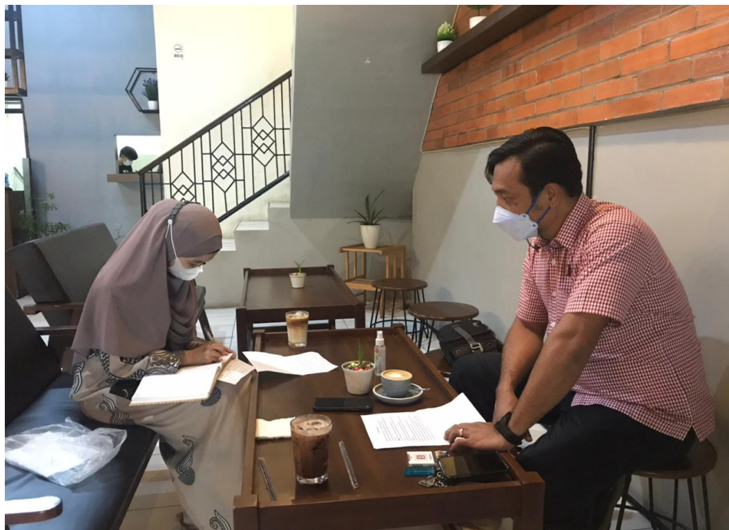
Gambar. 1: Wawancara dengan Panit 2 Unit 2 Subdit 5 Siber Ditreskrimsus Polda Sumatera Utara