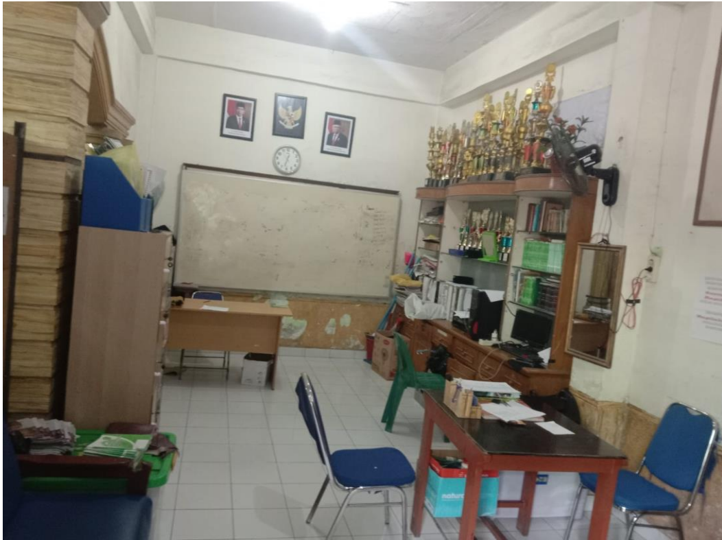
Gambar 7: Wawancara Guru BK Mts Swasta Al-Washliyah