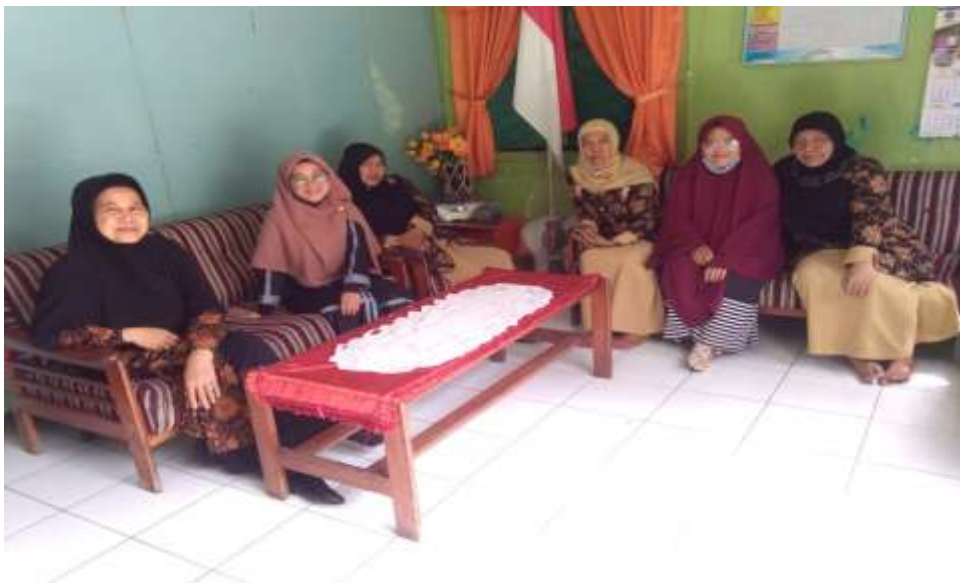
Gambar : 2

Ini adalah foto kepala sekolah RA Rahmah El-Yunusiyah IV dan para guru yang mengajar di RA tersebut. Dimana terlihat para guru sedang memegang piala hasil dari perlombaan RA tersebut.