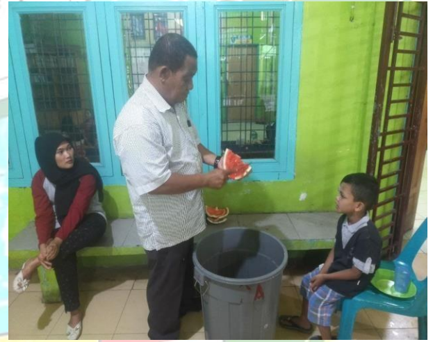
Ketua Panti sedang menyiapkan minuman Berbuka Puasa, Anak Asuh Panti Asuhan Putri Al Washliyah Binjai