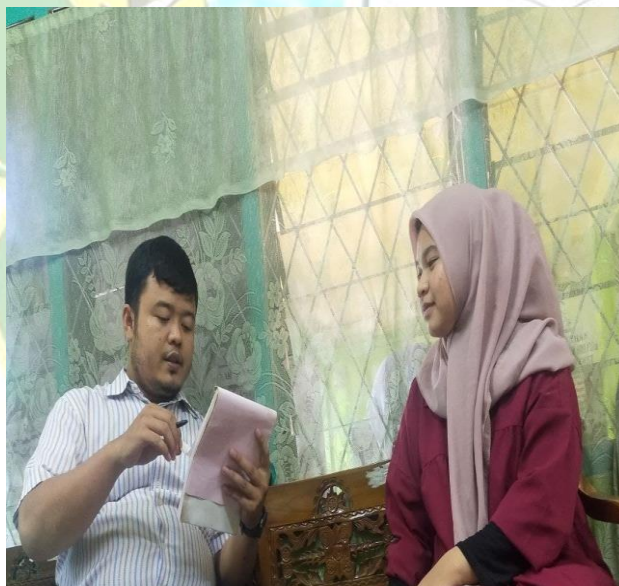
Sri rezeki Trinindung