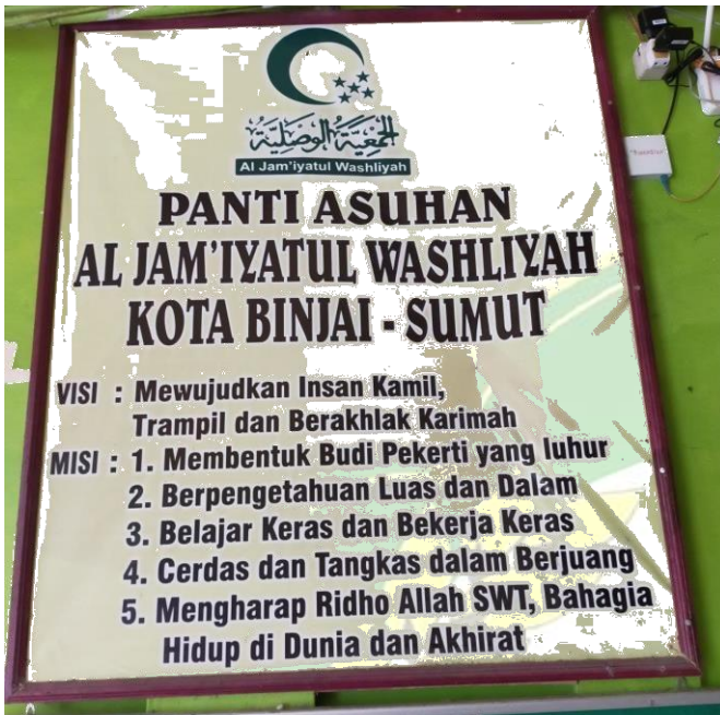
Visi Misi Panti Asuhan Al Washliyah Binjai