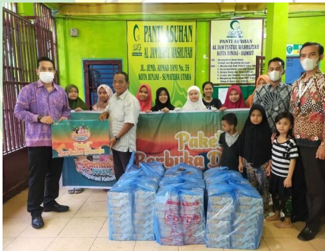
Kegiatan Anak - Anak Asuh Panti Asuhan Putri Al Washliyah Binjai