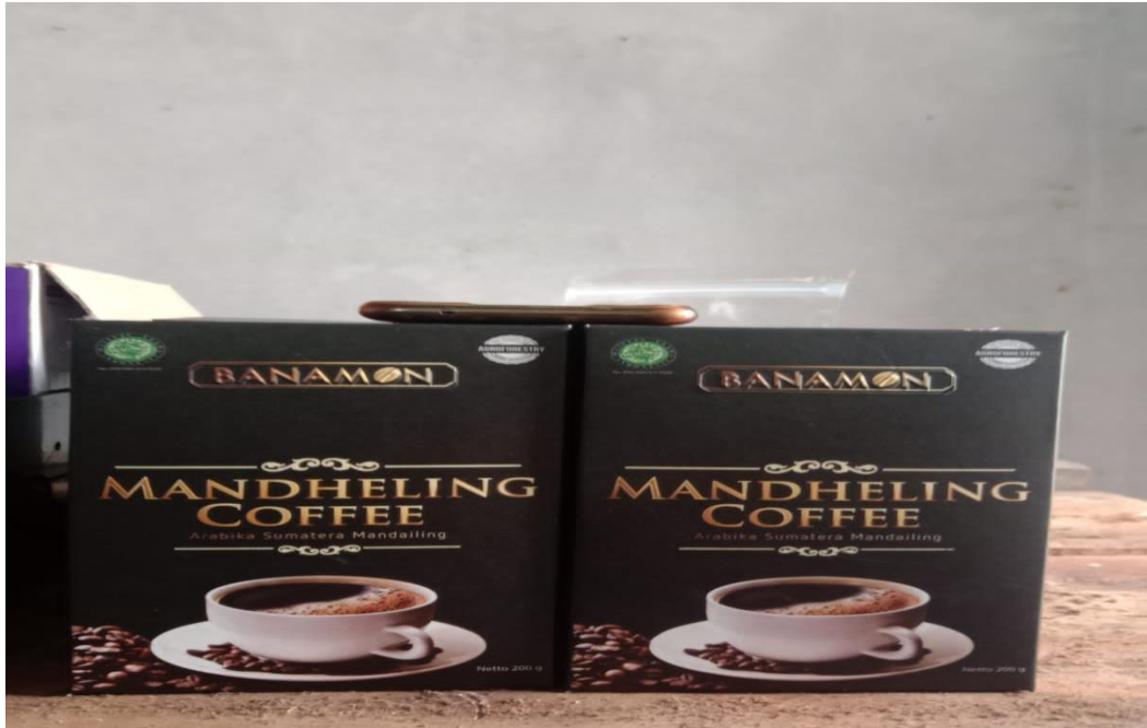
Kemasan Kopi Mandailing