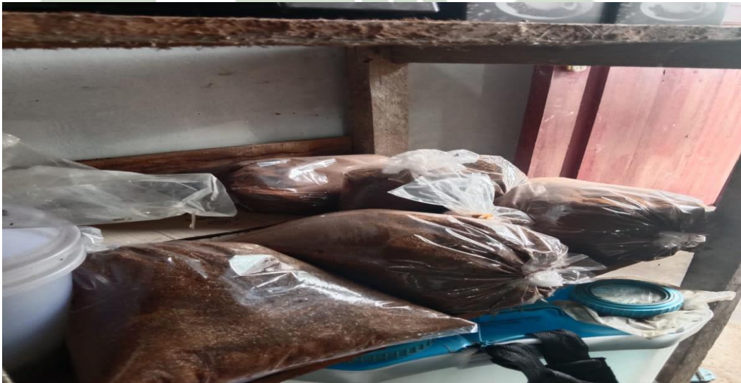
Kopi yang sudah di olah