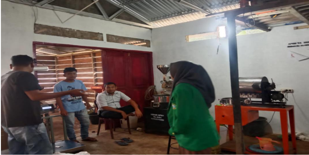
Wawancara Dengan Para Pegawai home industry