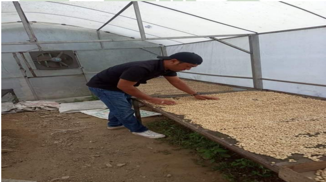
Proses Penjemuran Kopi