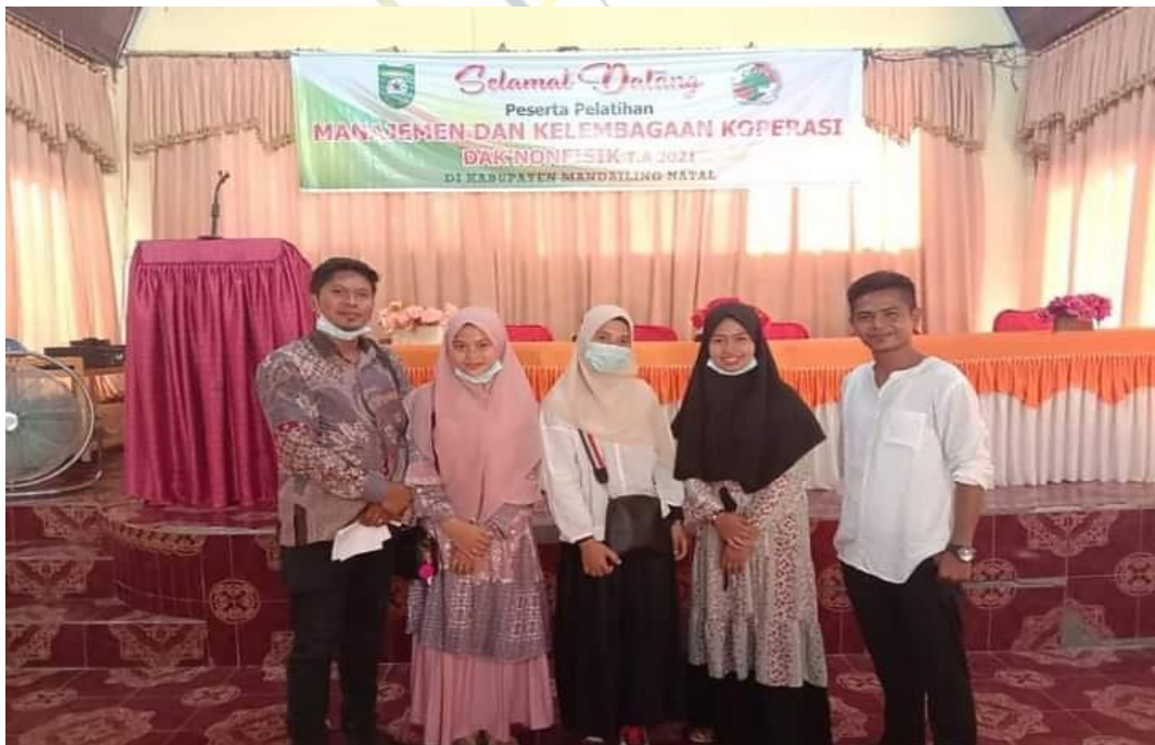
Mengikuti Kegiatan Dinas Koperasi