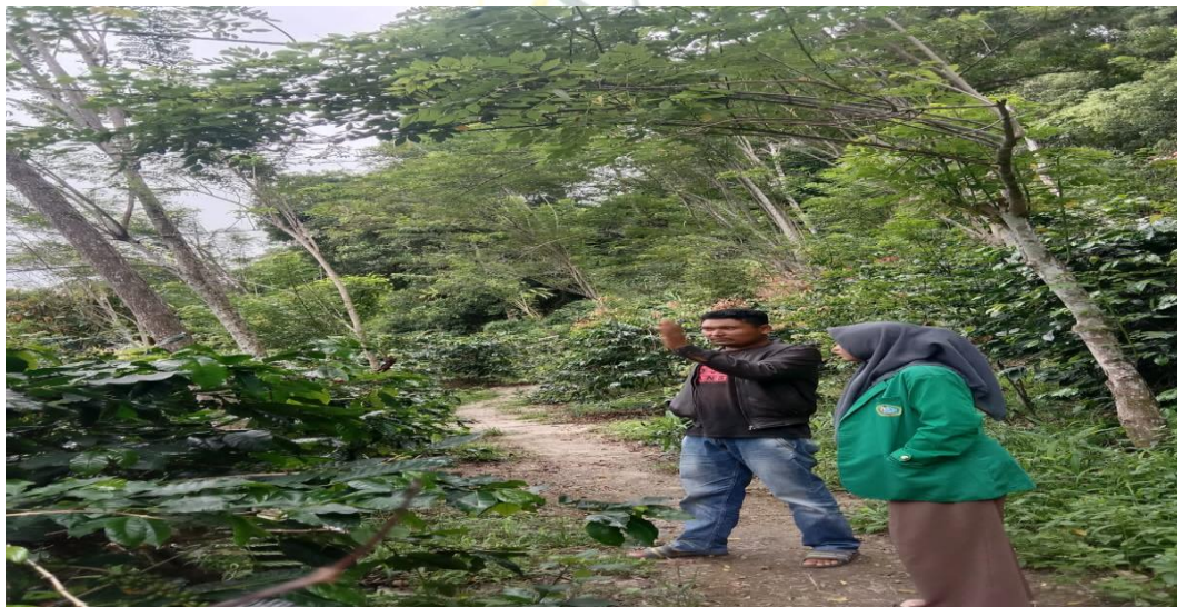
Wawancara dengan petani kopi