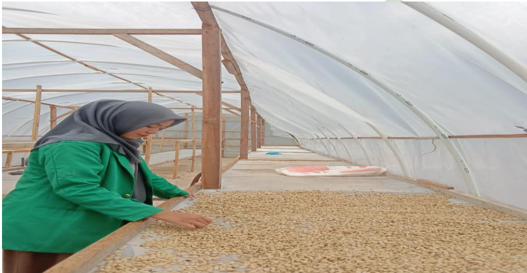
Kopi yang sudah dipanen akan dijemur