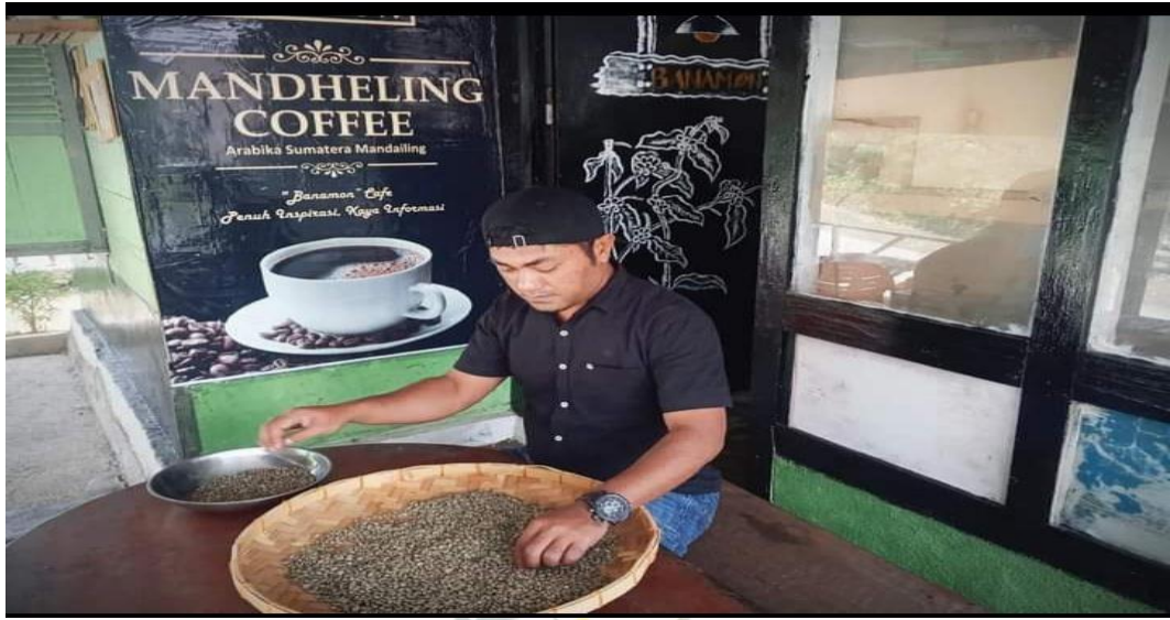
Proses Pemilihan Kopi