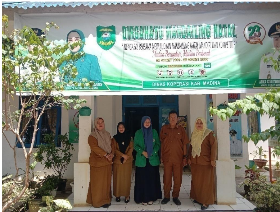
Wawancara dengan Pegawai Dinas Koperasi dan UMKM