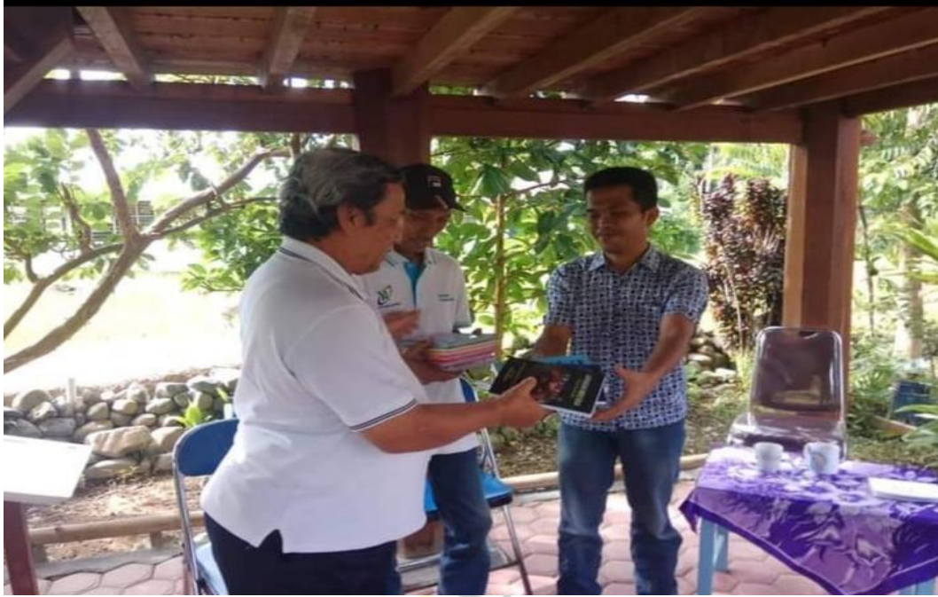
Menerima Buku pelatihan oleh anggota home industry