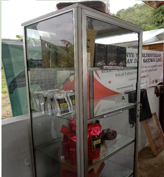
kopi Mandailing siap di Jual